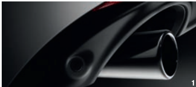
1. Double canule d'échappement chromée

Vitesse maxi (km/h) : 210 0 à 100 km/h : 9"50 1000 m DA : 30"60 Conso urbaine (l/100km) : 7.8 Conso extra-urbaine (l/100km) : 4.9 Conso mixte (l/100km) : 6 Emission CO 2 : 157 g/km