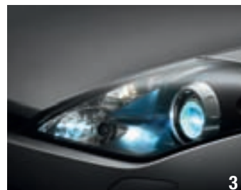
3. Projecteurs elliptiques bi-xénon