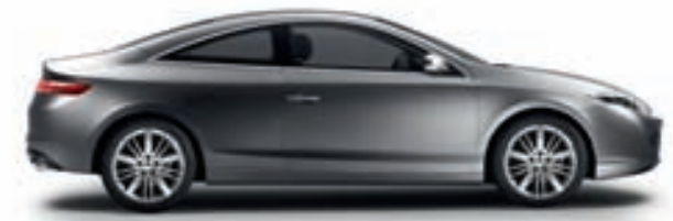
(tout l'univers Renault sur www.renault.tv )