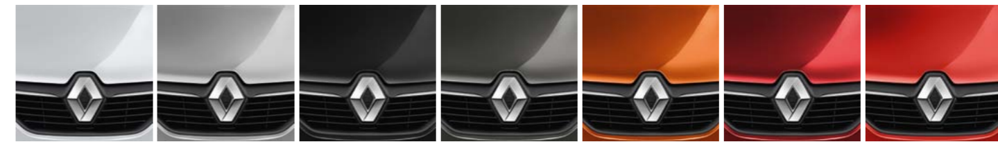
BRANCO NEIGE (OE)