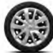
Calota Magiceo 15"