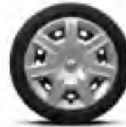
Calota Fuego 15"