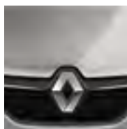
PRATA ÉTOILE (PM)