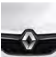
BRANCO NEIGE (OE)