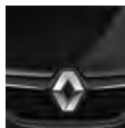
PRETO NACRÉ (PM)