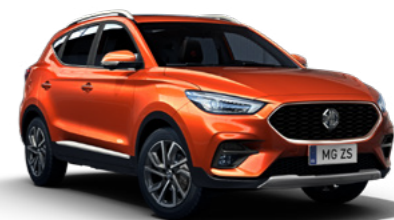
Hoxton Orange (en option)