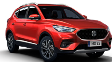
Diamond Red (en option)