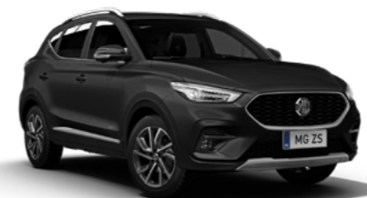
Pebble Black (en option)