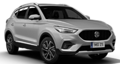
Cosmic Silver (en option)