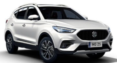
Dover White (de série)