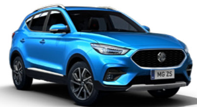
Como Blue (en option)