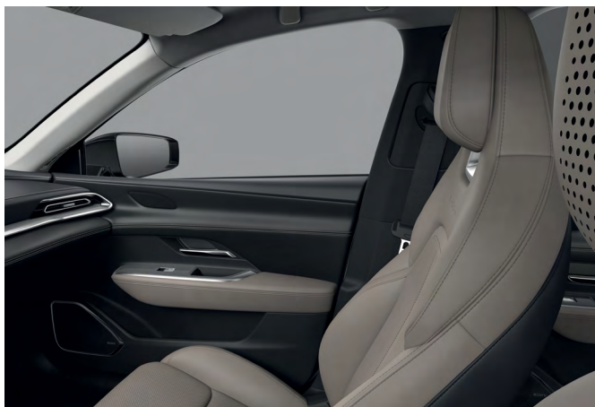
Sellerie synthétique « Beige »