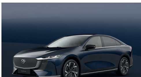
DEEP CRYSTAL BLUE | 750 €