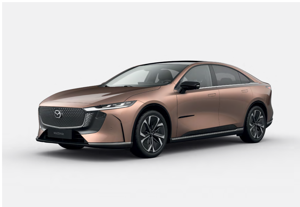
Mazda6e Takumi avec option peinture Melting Copper

Disponible en motorisations électriques 245ch et 258ch