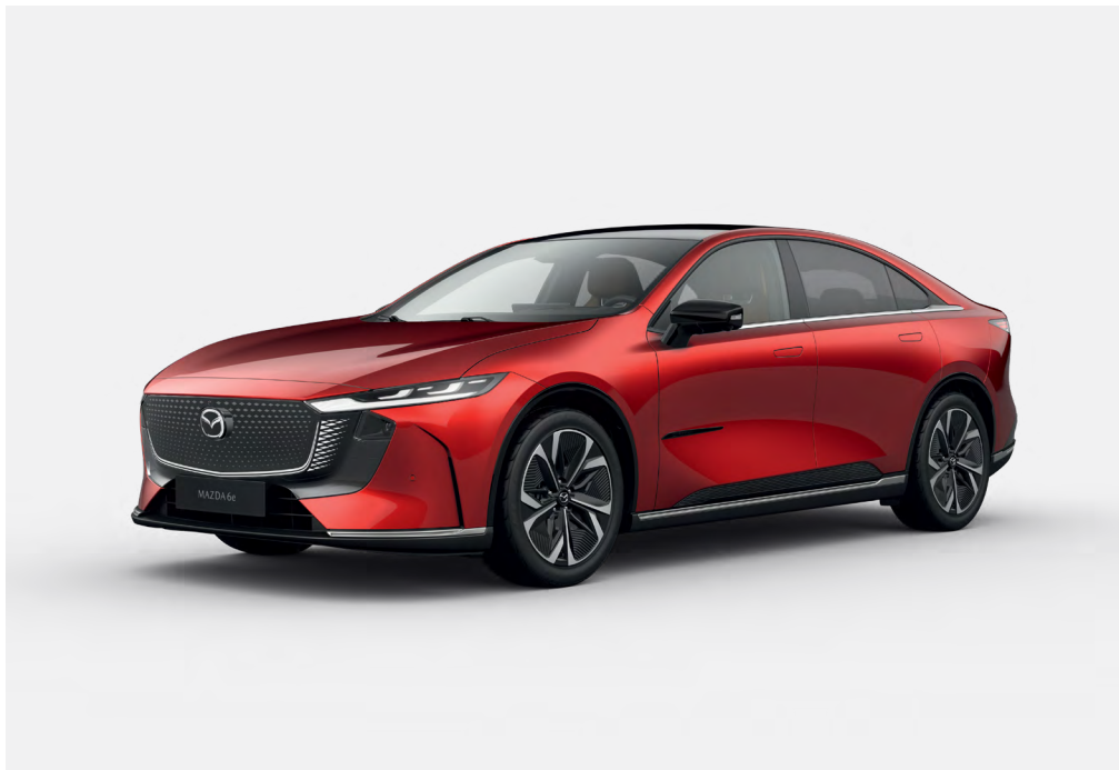
Mazda6e Takumi Plus avec option peinture Soul Red Crystal

Disponible en motorisations électriques 245ch et 258ch