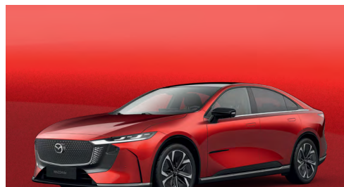
SOUL RED CRYSTAL | 1 050 €