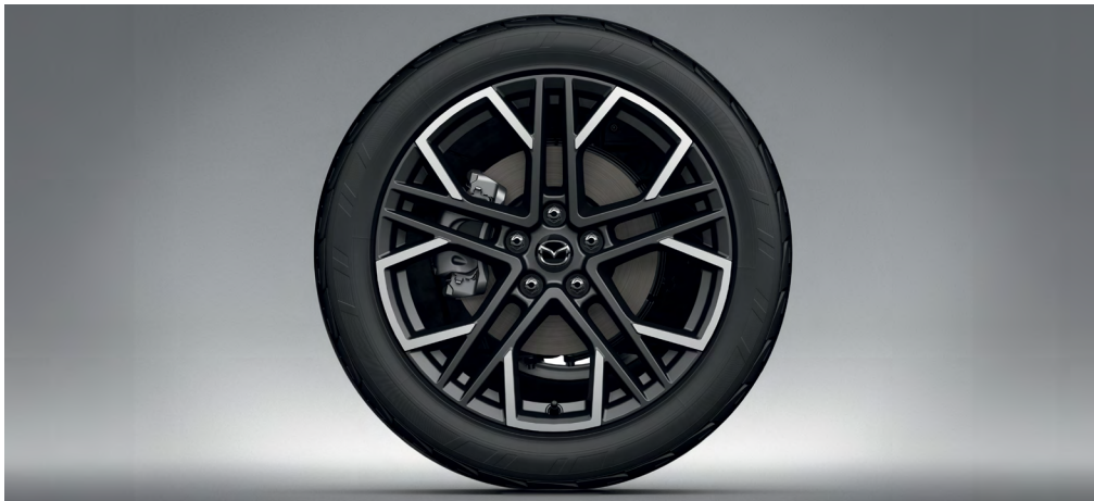
JANTES ALLIAGE 19" « DIAMOND CUT »