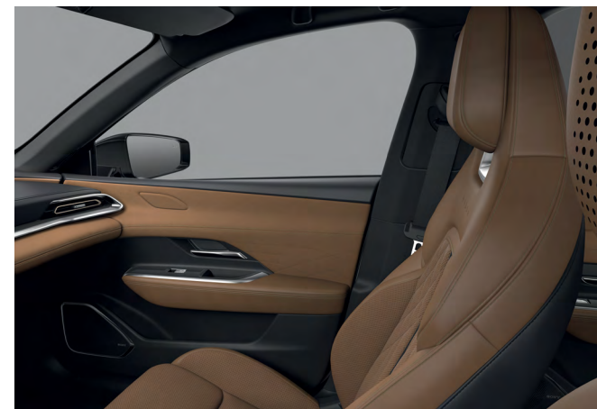
Sellerie cuir Nappa Tan et suédine*

* Seules les zones portantes des sièges (assise, dossier, renforts latéraux) sont revêtues des garnitures mentionnées.