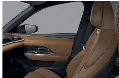
Sellerie cuir Nappa Tan et suédine*