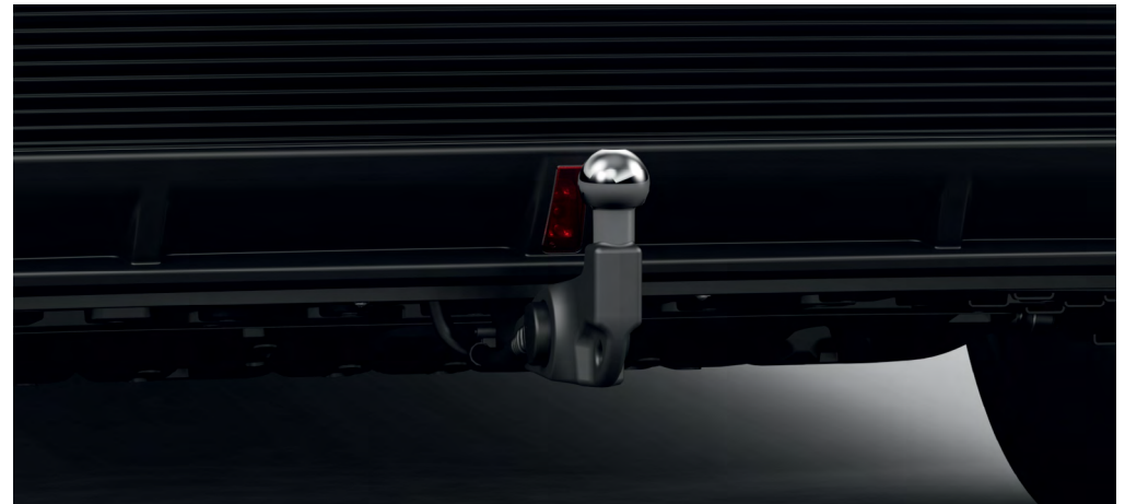
ATTELAGE RÉTRACTABLE, ÉLECTRIQUE, AVEC FAISCEAU D'ATTELAGE