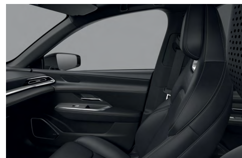
Sellerie synthétique « Noir »