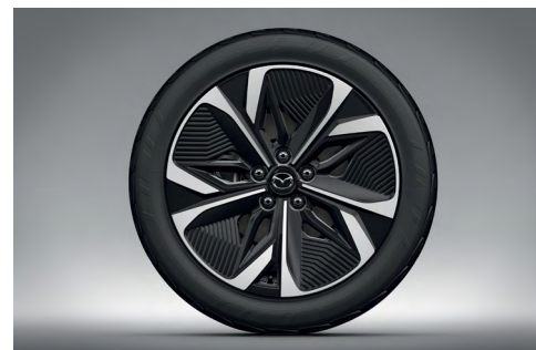
Jantes alliage 19" « Black Silver Aerodynamic » (245/45R19 Michelin)