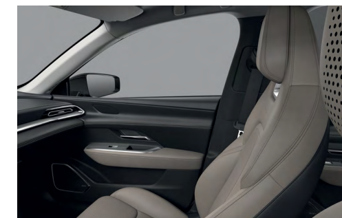
Sellerie synthétique « Beige »