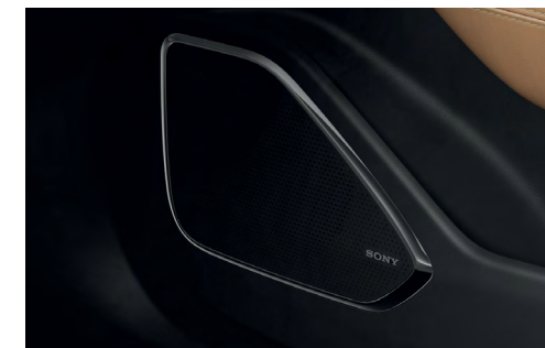
Système audio avec radio FM/DAB et 14 haut-parleurs Sony™