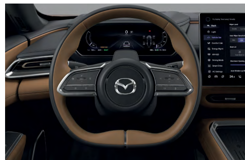
Volant gainé de cuir bi-ton