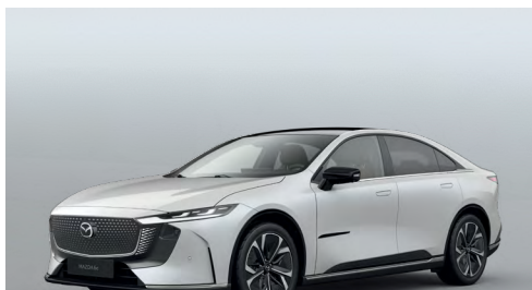
CRYSTAL WHITE PEARL | 0 €