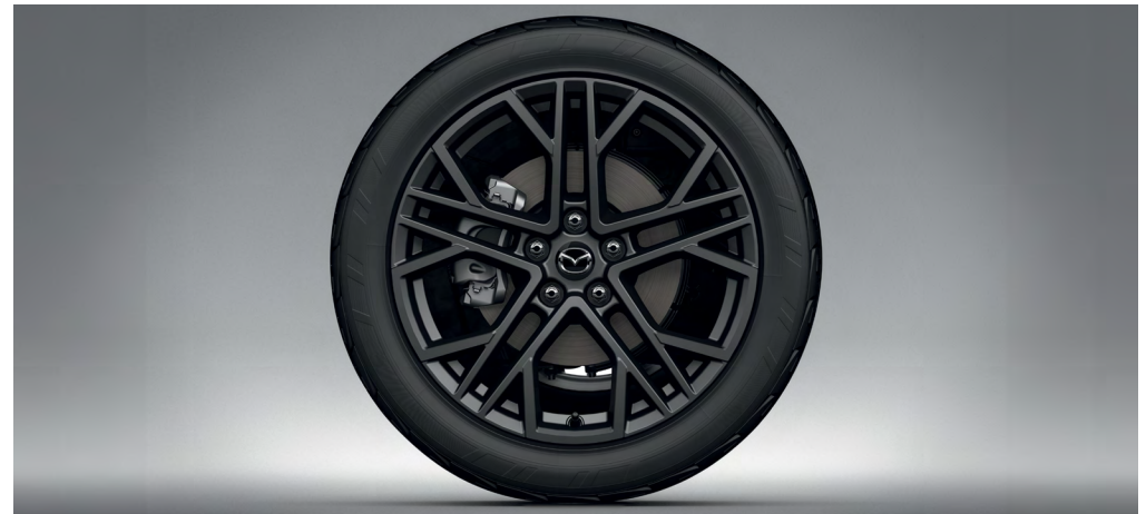
JANTES ALLIAGE 19" « ANTHRACITE BRILLANT »