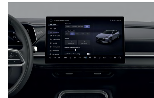
Ecran central avec système d'infodivertissement 14,6"