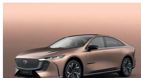
MELTING COPPER | 750 €