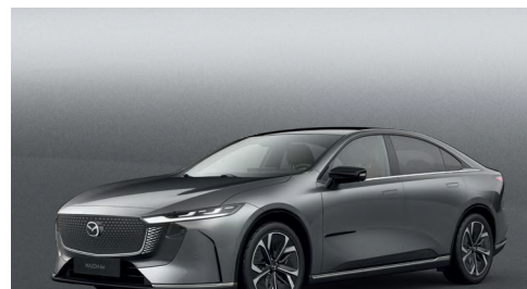
MACHINE GREY | 900 €