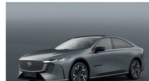
POLYMETAL GREY | 750 €