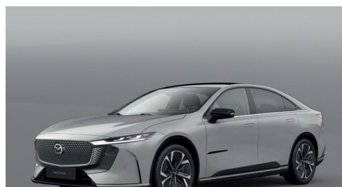
AERO GREY | 750 €