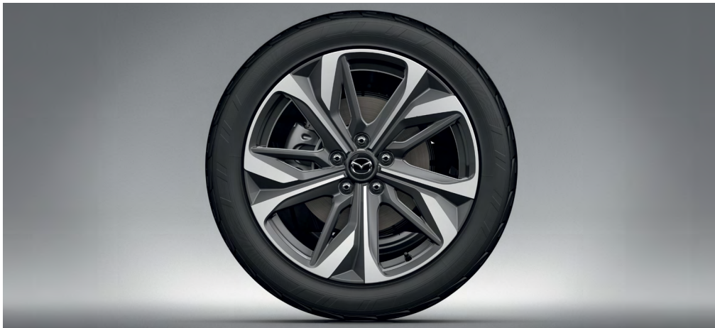
JANTES ALLIAGE 19" « Design 180 »