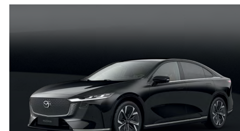
JET BLACK | 750 €

Utilisez notre configurateur pour trouver la Mazda6e qui vous convient.