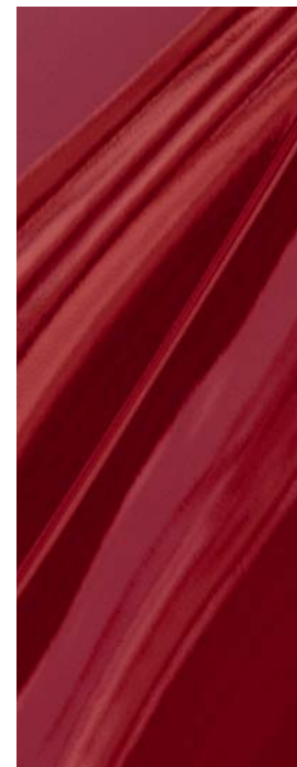
Machine Gray Métallisé