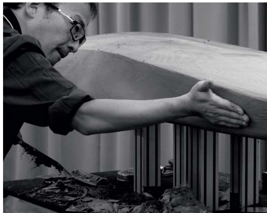
MAZDA TAKUMI : UN SAVOIR-FAIRE INESTIMABLE