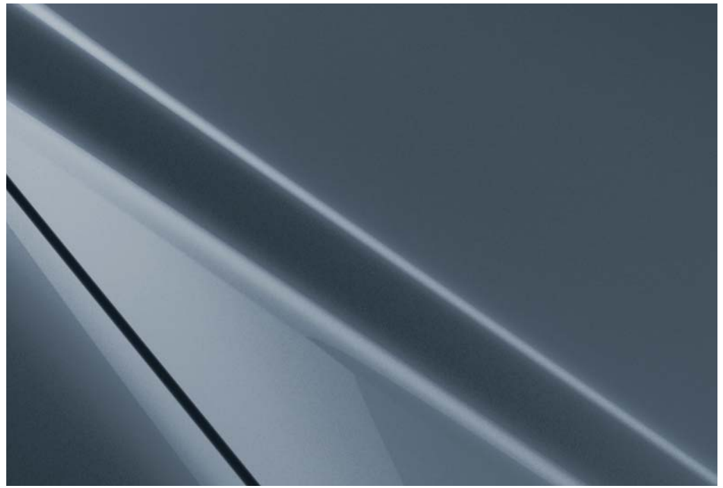
Polymetal Gray Métallisé