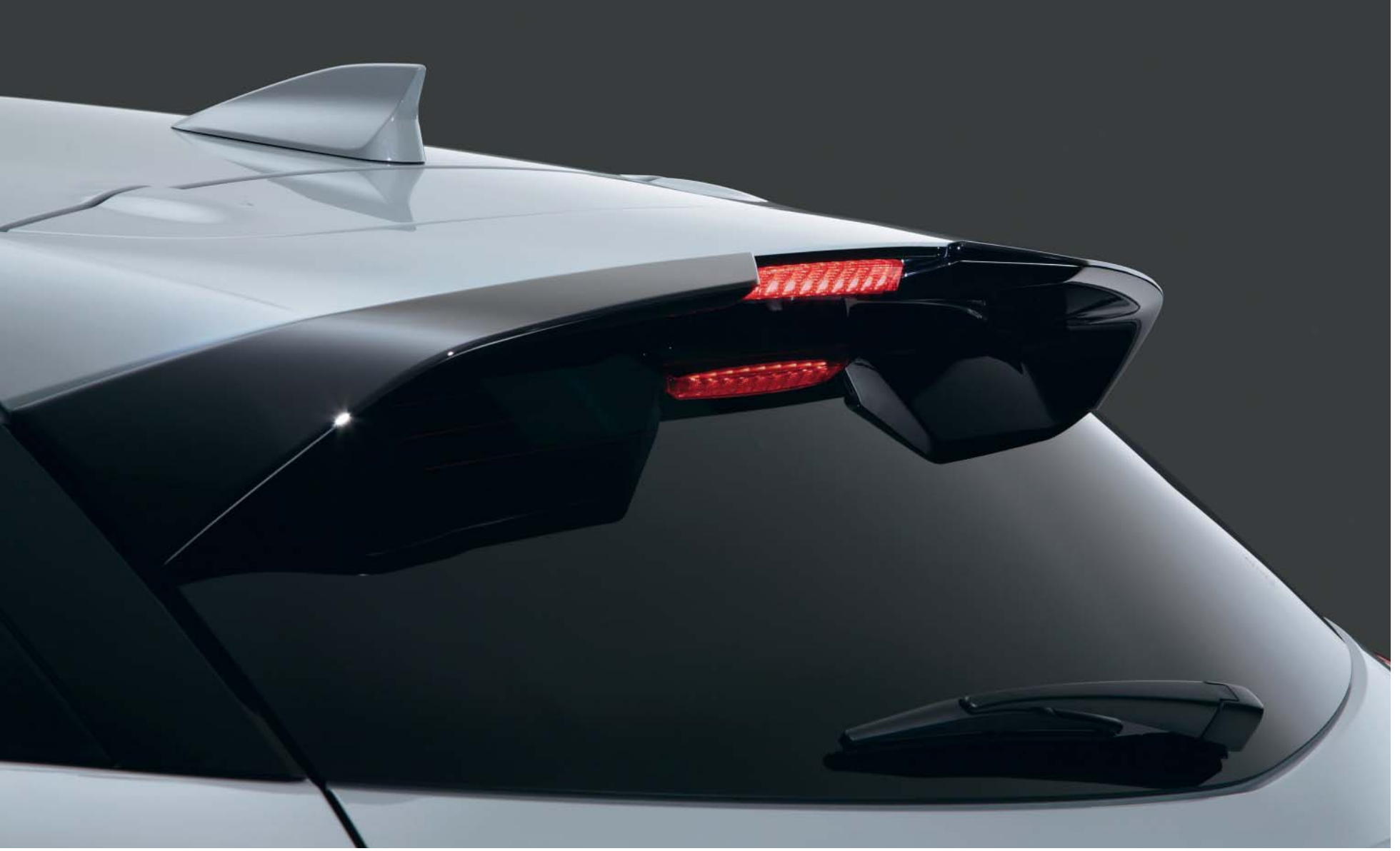
Becquet De Toit Arrière