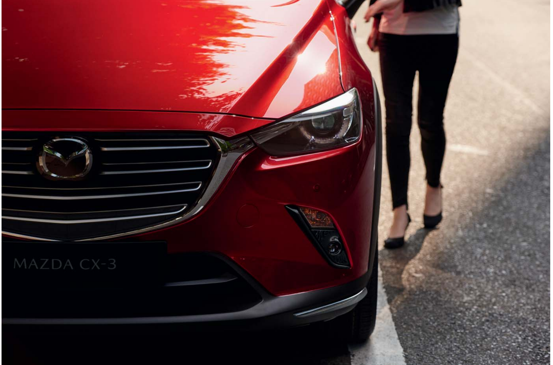
Mazda CX-3 Sélection avec option peinture Métallisée Soul Red Crystal