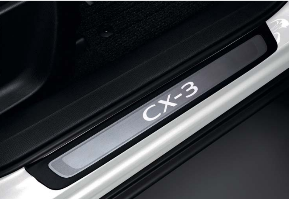
Seuils De Portes Illuminés