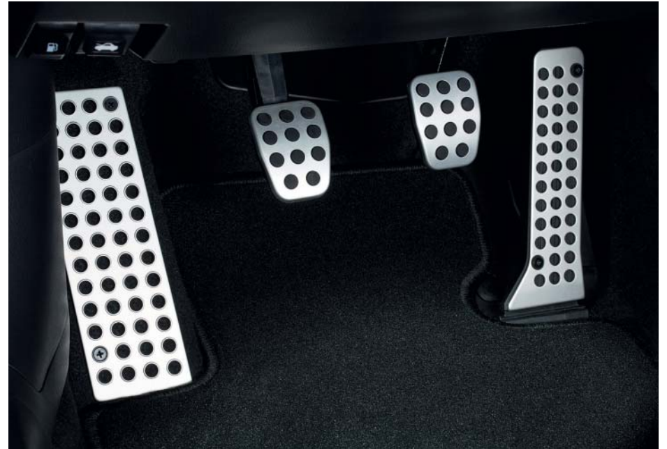
Pédalier et repose-pied aluminium