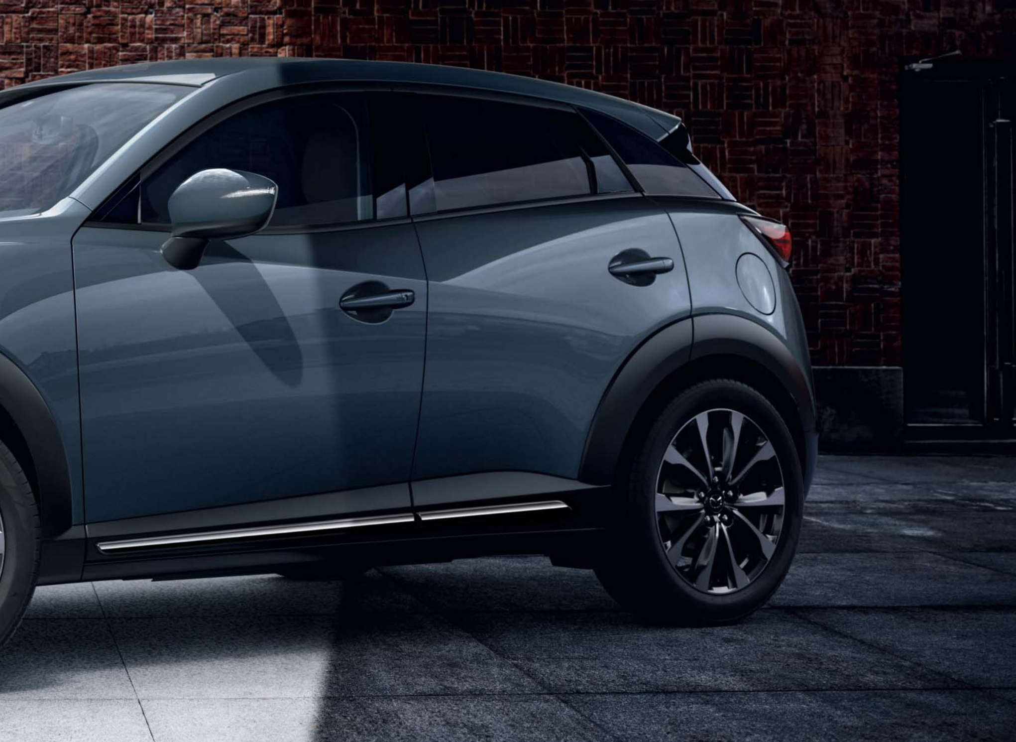
Mazda CX-3 Sélection avec option peinture Métallisée Polymetal Gray