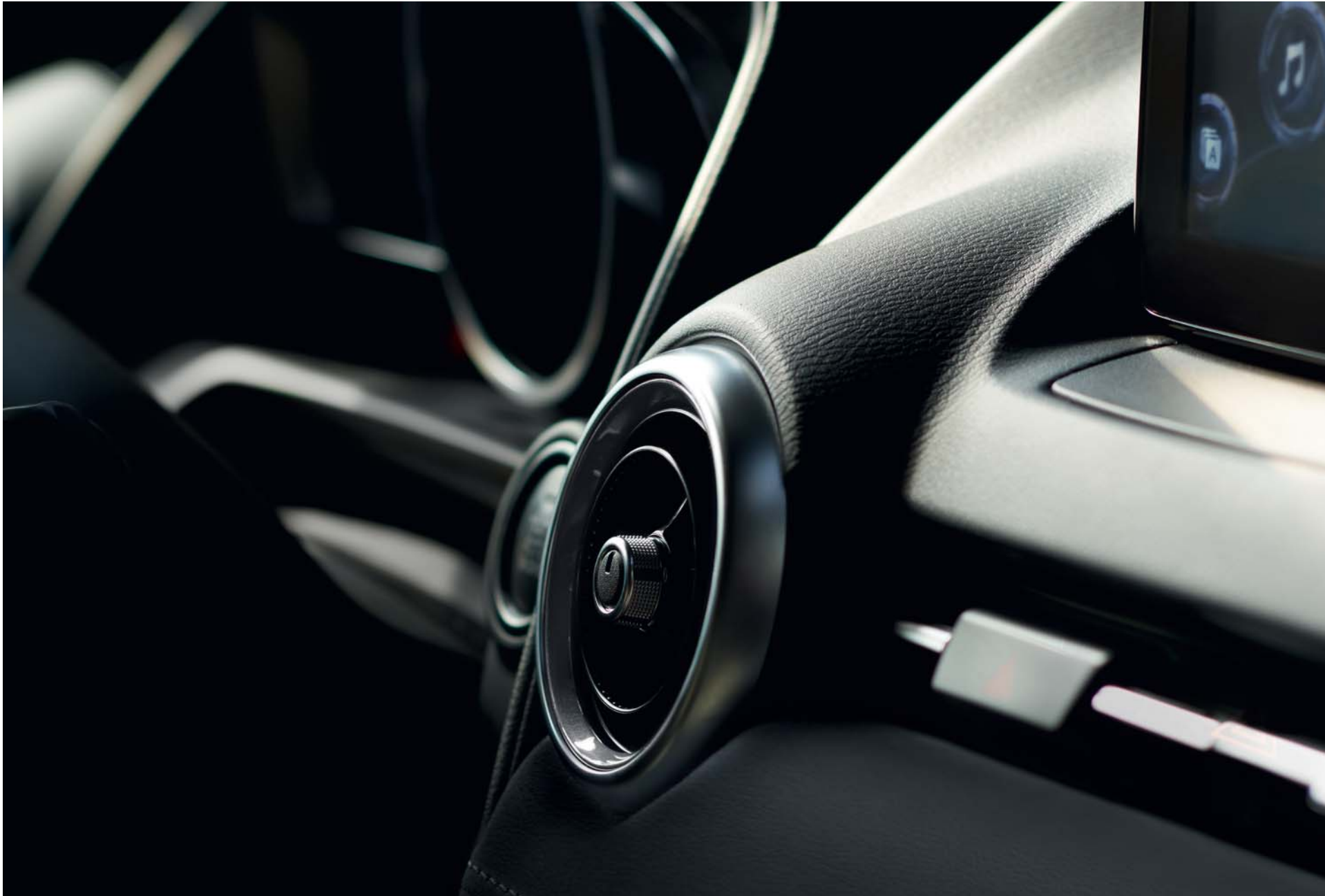
Mazda CX-3 Sélection avec option peinture Polymetal Gray Métallisé