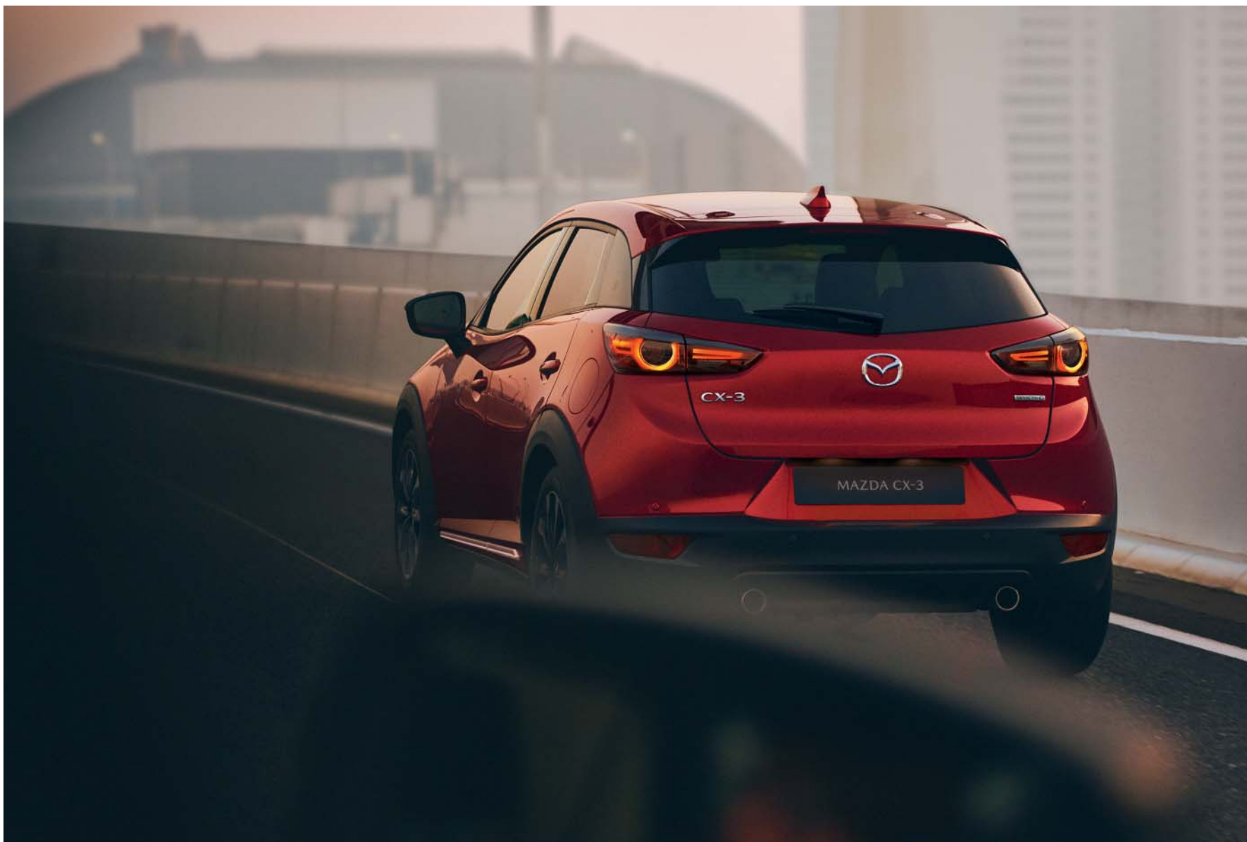
Mazda CX-3 Sélection avec option peinture Métallisée Soul Red Crystal