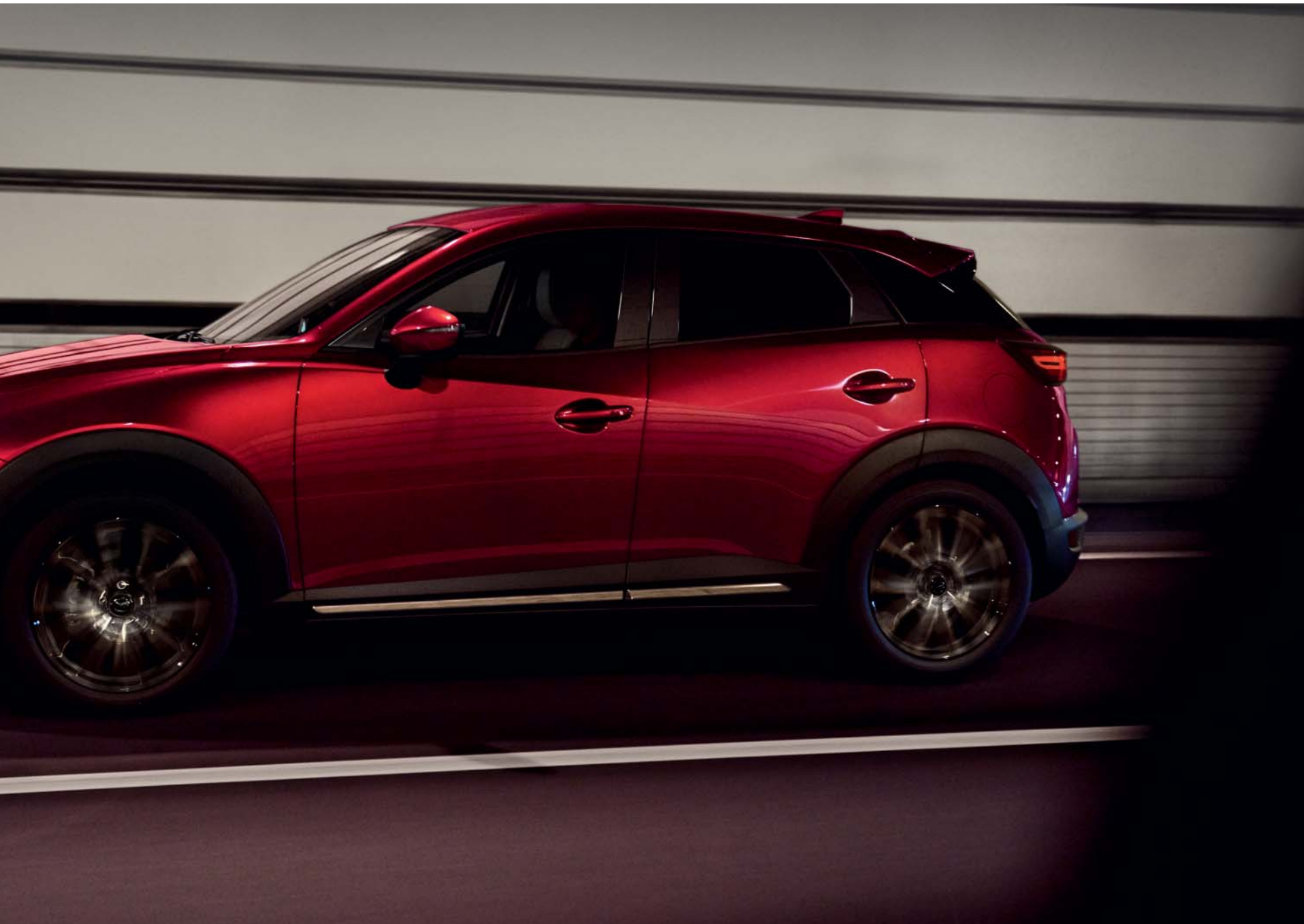
Mazda CX-3 Sélection avec option peinture Métallisée Soul Red Crystal