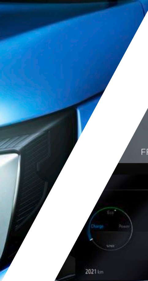
FREINAGE D'URGENCE AUTOMATIQUE