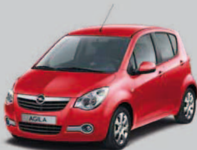
▲ Rouge Ardent