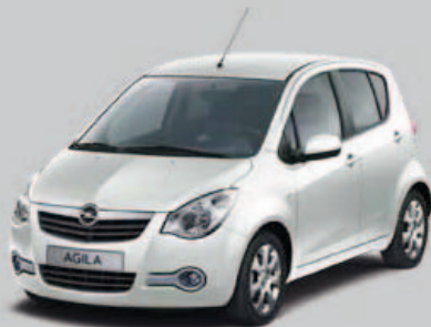
▲ Blanc Ecrins