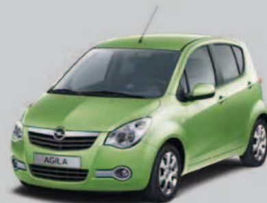
▲ Vert Nature