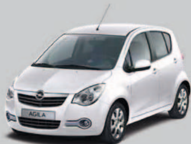
▲ Blanc Galaxie