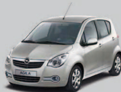
▲ Gris Acier