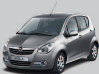
▲ Gris Météorite