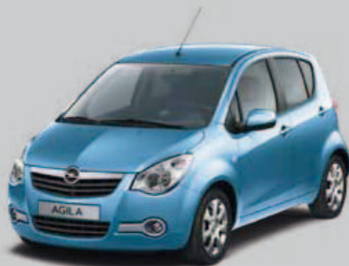
▲ Bleu Californien