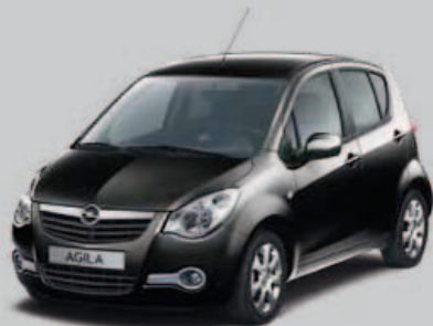
▲ Noir Cosmos