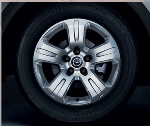
1 Jante alliage 7 J x 17", 5 branches, pneus 235/65 R 17.