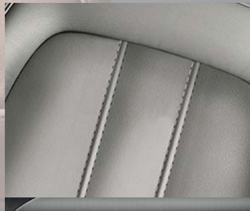
Cuir Mondial Titanium. 2