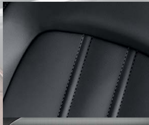
Cuir Mondial Anthracite. 2