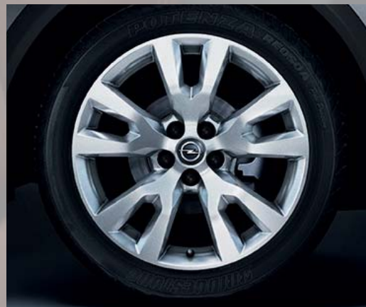
2 Jante alliage 7 J x 19", 5 branches en V, pneus 235/50 R 19.