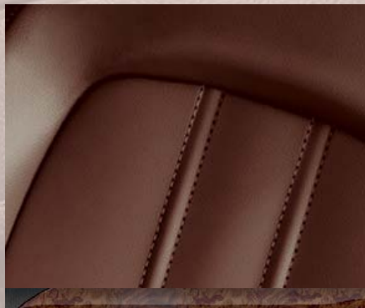
Cuir Mondial Brun. 2