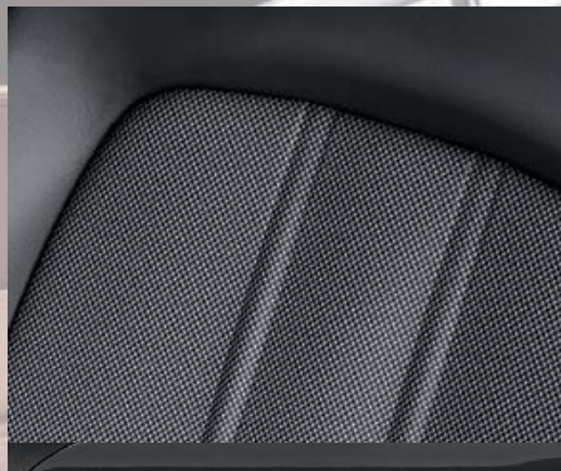
Morrocana Anthracite. 1