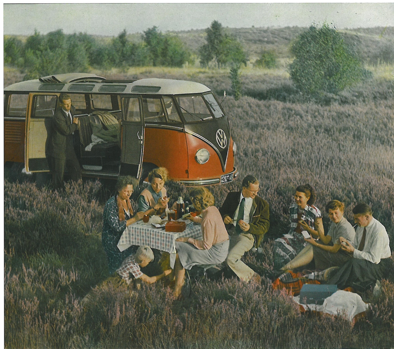
Le Pique-Nique à 8 (sans parler du petit garçon)