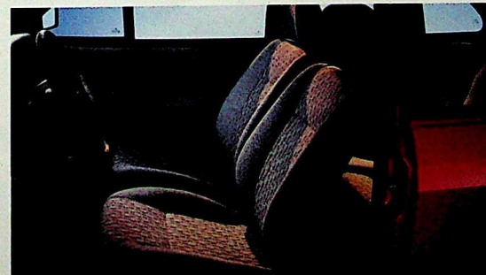
Habitacle de la Polo CL. Réglage de la portée des phares en option.

Jamais encore la parcimonieuse fourmi ne s'était livrée à de telles folies!