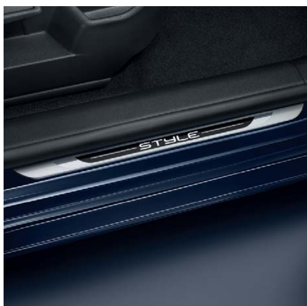
Barres de seuil siglées 'Style'.