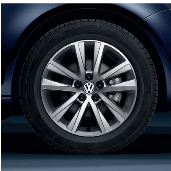
Jante en alliage léger 'Estrada' 16" avec pneumatiques 205/55 R16.

Que penser de tout cela si ce n'est qu'un seul qualificatif peut désigner cette série spéciale ; Décidément cette série spéciale a du 'Style' !