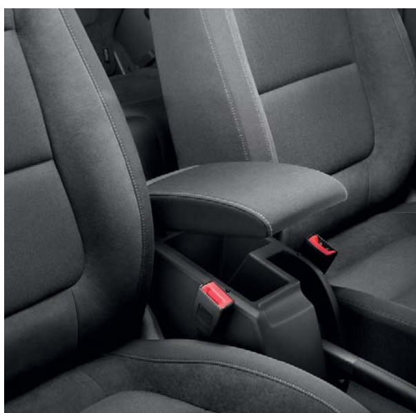
Accoudoir central à l'avant et sellerie 'Austin Black' tissu/Alcantara.