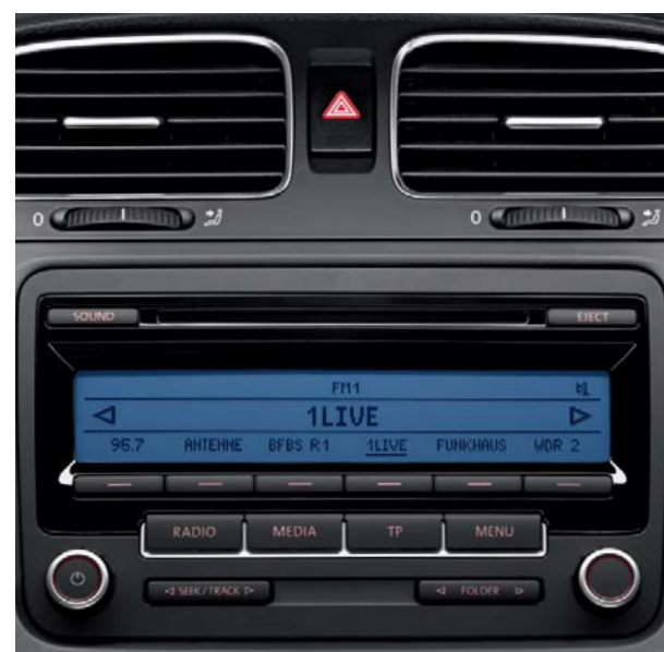
Radio CD 'RCD 310' MP3, 4 X 20 watts et 8 haut-parleurs.