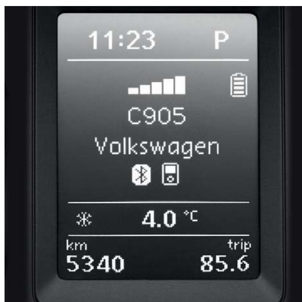
Interface Bluetooth pour téléphone portable.