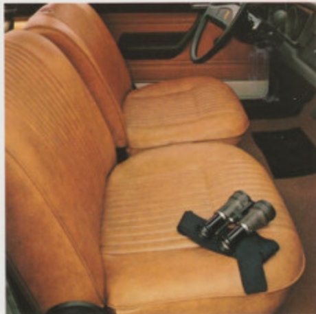
Garniture des sièges en Tepluxe. Tapis moquette aux places avant.

Break 304 livrable avec peintures métallisées et sellerie intérieure deux tons.