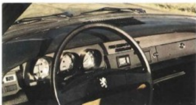
Planche de bord gainée avec épais bourrelets de sécurité. Compte-tours, montre électrique, allume-cigarettes, éclairage de nuit des commandes de climatisation.