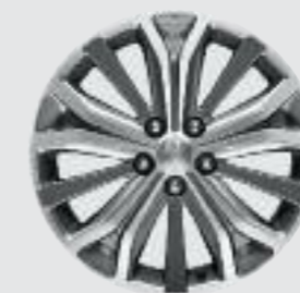
Jante aluminium 18"