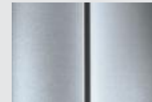
Gris Cool Silver