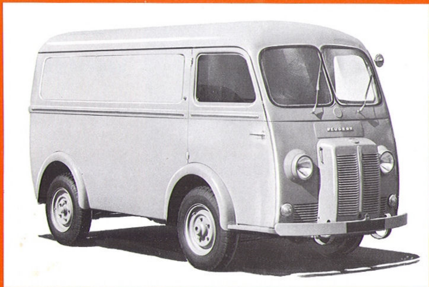
Fourgon tôlé D4B charge utile 1400 kg.