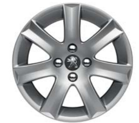
JANTE ALUMINIUM 16" SPA*