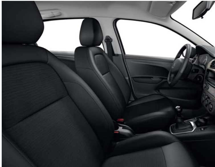
03 TISSU OLINE MISTRAL