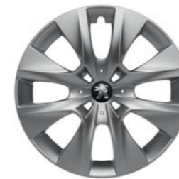
ENJOLIVEUR 15" BORE*