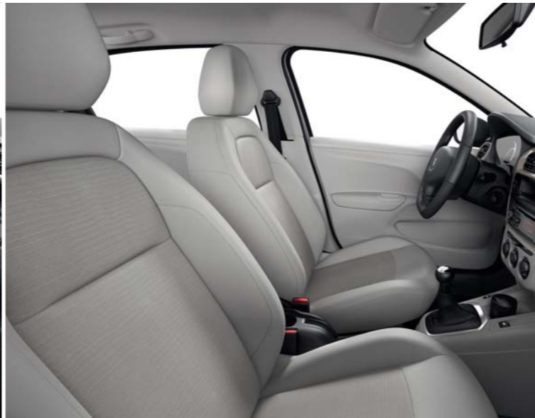
04 TISSU OLINE LAMA