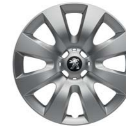
ENJOLIVEUR 15" HOBART*