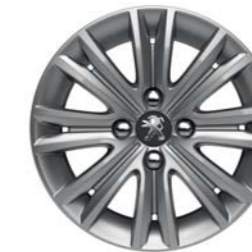
JANTE ALUMINIUM 15" HARVEY *