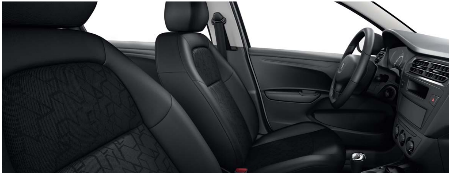
05 TISSU ISAR MISTRAL