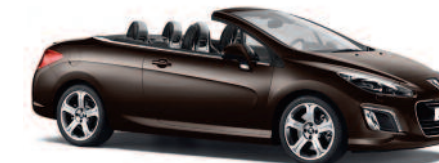
Brun Guaranja (Disponible à partir de fin 2011)