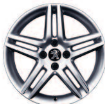
Jante aluminium Stromboli 17"