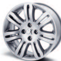
Jante alliage Kapsiki 17"