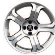
Jante aluminium Lincancabur 18"