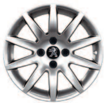
Jante aluminium Izalco 16"