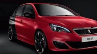
Rouge Ultimate / Noir Perla Nera