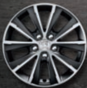
Jante aluminium 16" diamantée TOPAZE