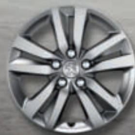
Jante aluminium 16" QUARTZ