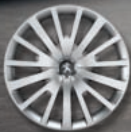
Enjoliveur 15" AMBRE