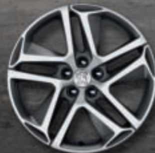
Jante aluminium 18" diamantée SAPHIR*

*En série ou en option selon les finitions