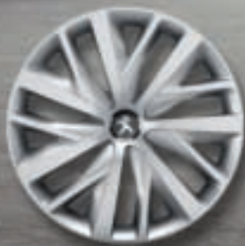
Enjoliveur 16" CORAIL