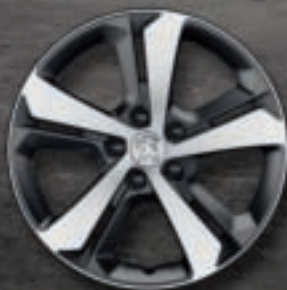
Jante aluminium 17" diamantée RUBIS*