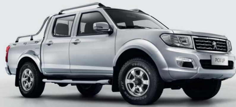
4 roues motrices Light Grey