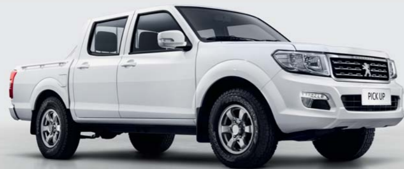
2 roues motrices Nordic White