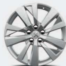
Jante alliage 17" CHICAGO*