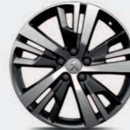
Jante alliage 18" DETROIT bi-ton diamantée*