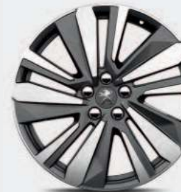
Jante alliage 19" WASHINGTON bi-ton diamantée**