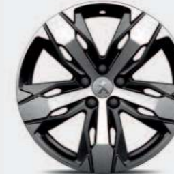
Jante alliage 18" LOS ANGELES bi-ton diamantée**