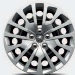
Jante tôle 17" avec enjoliveur MIAMI*

* De série ou indisponible selon les versions ** En option ou indisponible selon les versions