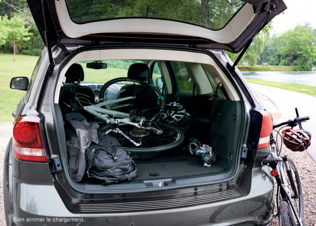
Bien arrimer le chargement.