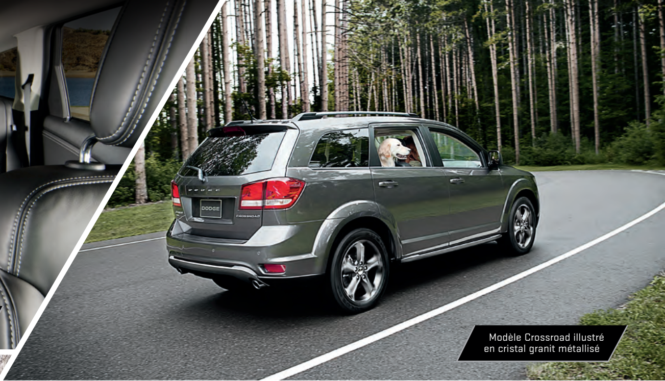
Modèle Crossroad illustré en cristal granit métallisé