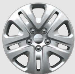
Roues de 17 po en acier avec enjoliveurs De série avec l'ensemble Valeur Plus