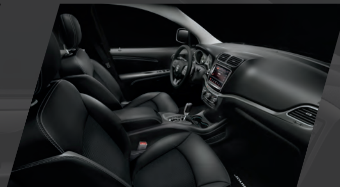
À dessus en cuir avec empiècements en filet sport – noir avec coutures contrastantes gris clair De série sur le modèle Crossroad