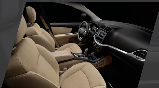
Tissu – beige givré clair De série sur le modèle avec ensemble Valeur Plus