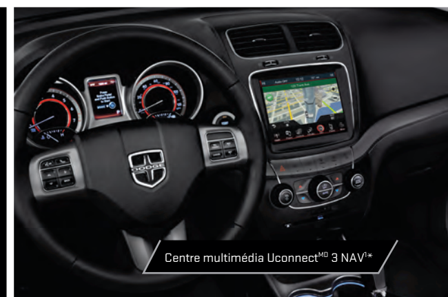
Centre multimédia Uconnect TM 3 NAV 1*

* Remarque à propos de ce catalogue : tous les avis de non-responsabilité et les divulgations figurent sur la dernière page.