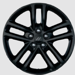
Roues de 17 po en aluminium noir Livrables en option sur les modèles avec ensemble Valeur Plus et ensemble Blacktop