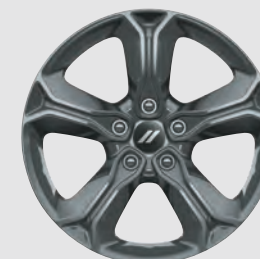
Roues de 19 po en aluminium noir De série sur le modèle Crossroad