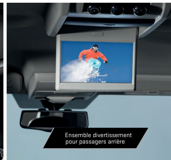
Ensemble divertissement pour passagers arrière