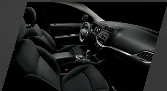
Tissu – noir De série sur le modèle avec ensemble Valeur Plus