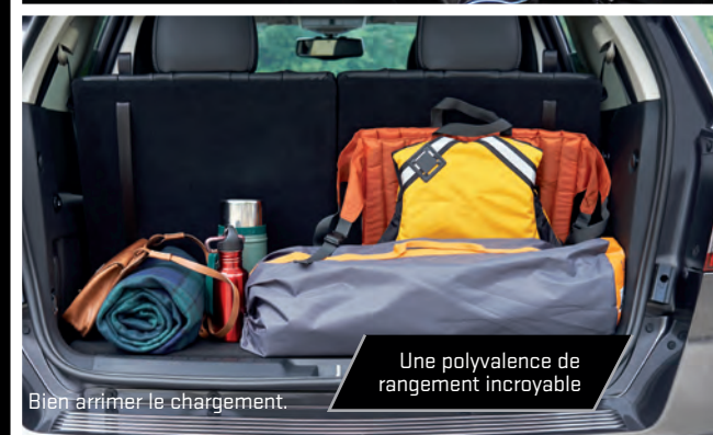
Une polyvalence de rangement incroyable