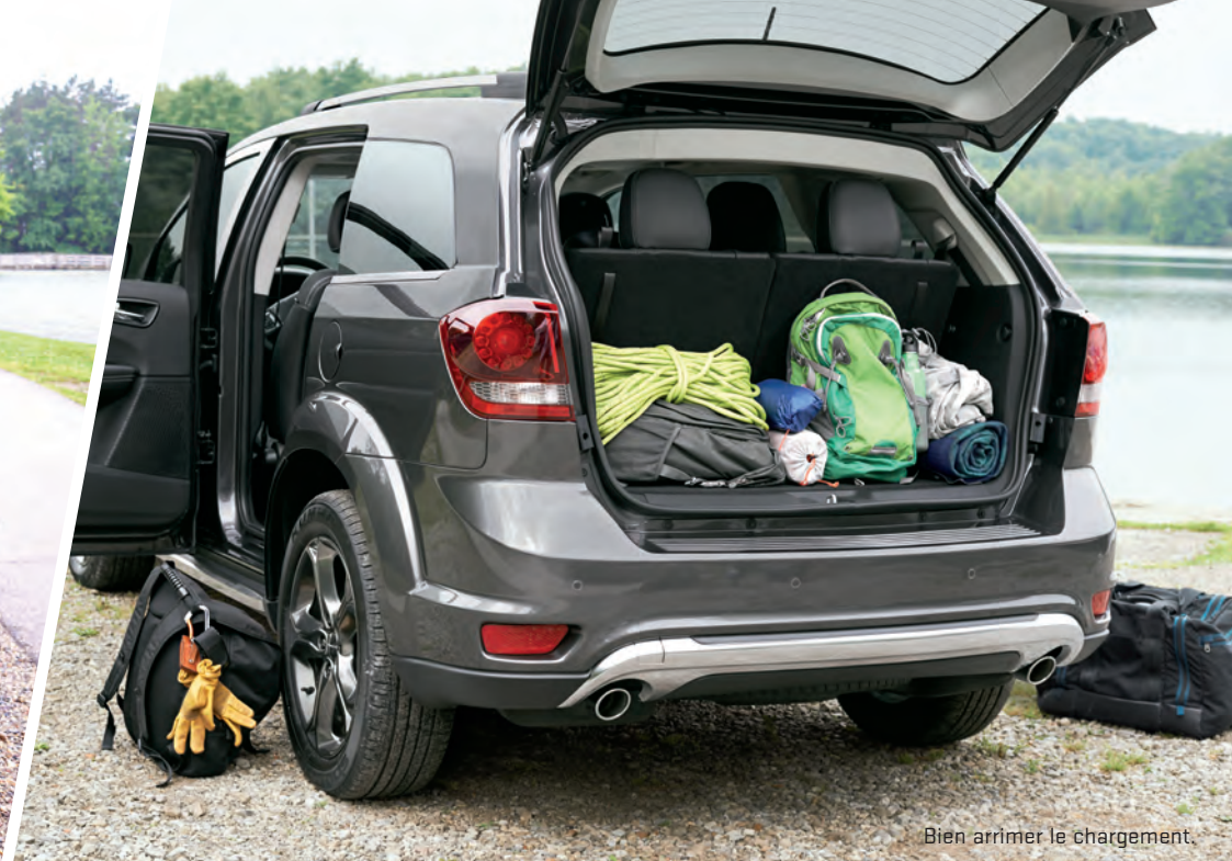
Bien arrimer le chargement.