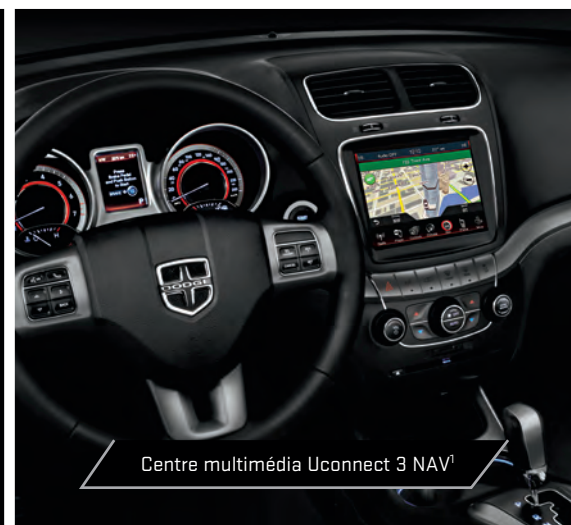
Centre multimédia Uconnect 3 NAV 1

L'intérieur du Journey Crossroad a été soigneusement conçu. Il a été judicieusement conçu pour offrir au conducteur comme aux passagers des sièges confortables avec une vue sur la route grâce aux sièges disposés en gradins, une expérience sonore agréable grâce à des haut-parleurs et un caisson d'extrêmes graves de catégorie supérieure stratégiquement placés, un centre multimédia Uconnect MD 3 NAV 1 de série doté d'une radio à écran tactile de 8,4 po avec système de navigation 1 et radio satellite SiriusXM 2 avec un abonnement d'un an. Le siège du conducteur à 10 réglages électriques, dont le support lombaire à 4 réglages électriques, les sièges avant chauffants et un volant chauffant gainé de cuir sur toute sa circonférence ajoutent une touche de luxe. Notons comme caractéristiques de commodité un toit ouvrant à commande électrique, un démarreur à distance et des bacs de rangement dans le plancher.