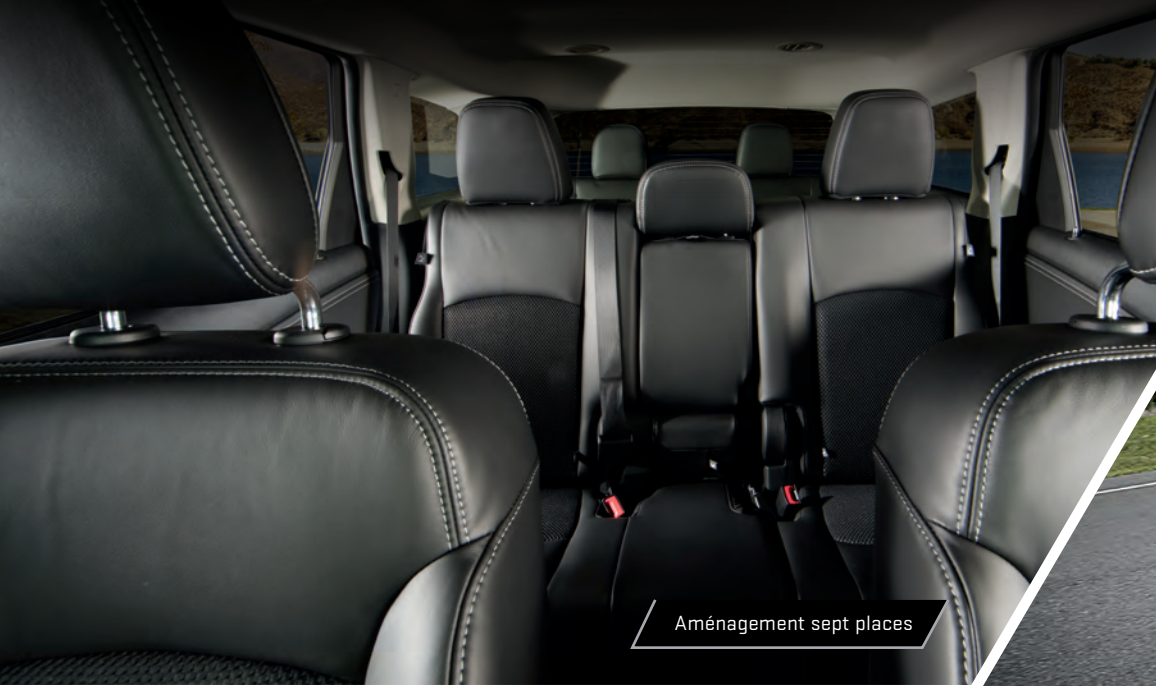
Aménagement sept places