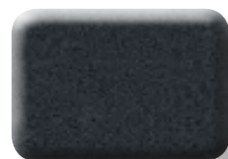
CRISTAL GRANIT MÉTALLISÉ

Toutes les couleurs ne sont pas livrables sur tous les modèles.