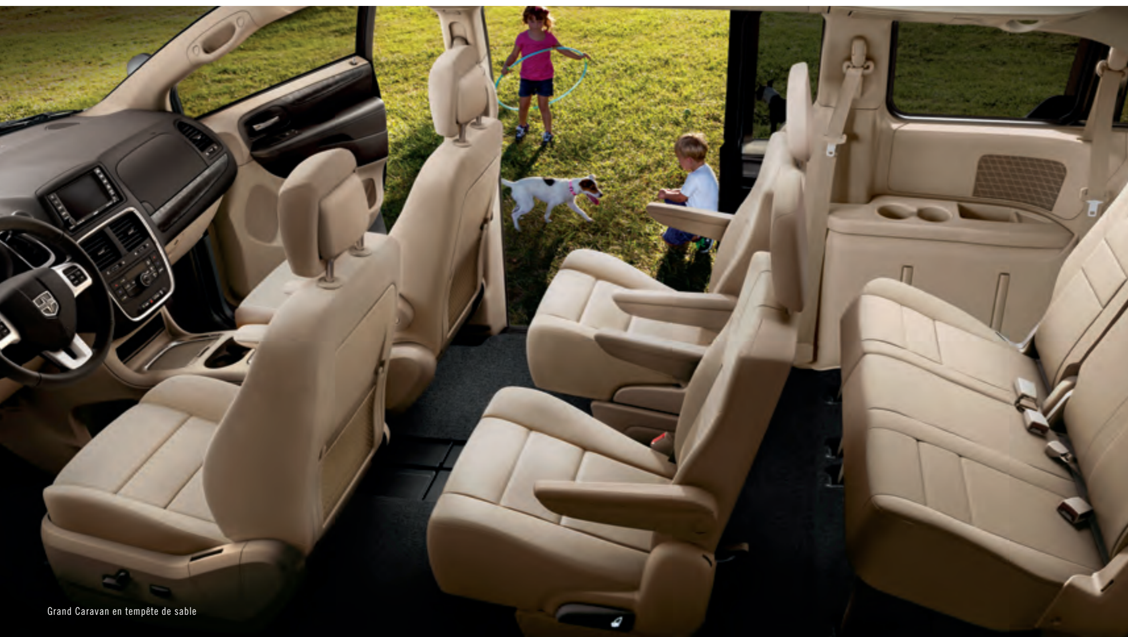
Grand Caravan en tempête de sable