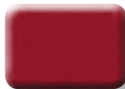
COUCHE NACRÉE LIGNE ROUGE