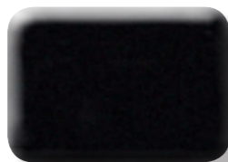
COUCHE NACRÉE CRISTAL NOIR ÉTINCELANT