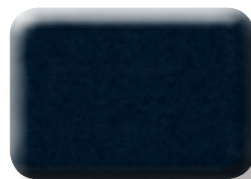
ACIER INTENSE MÉTALLISÉ