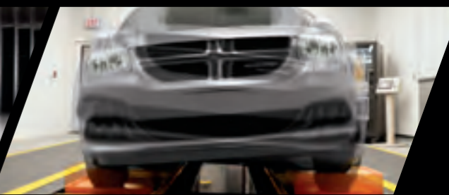
VIBRATEUR À QUATRE POTEAUX — ESSAI DE SUSPENSION