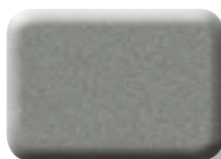
GRIS ACIER MÉTALLISÉ