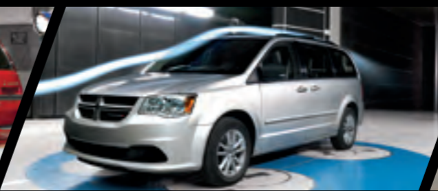
ESSAI EN SOUFFLERIE