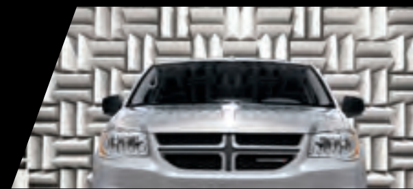
CHAMBRE ANÉCHOÏQUE — ESSAI DES BRUITS, VIBRATIONS ET SECOUSSES (BVS)