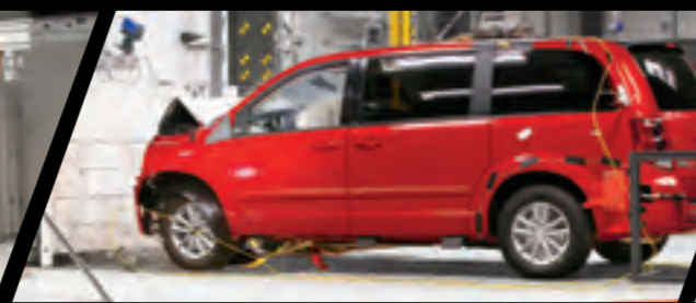
ESSAI DES ZONES DE COLLISION