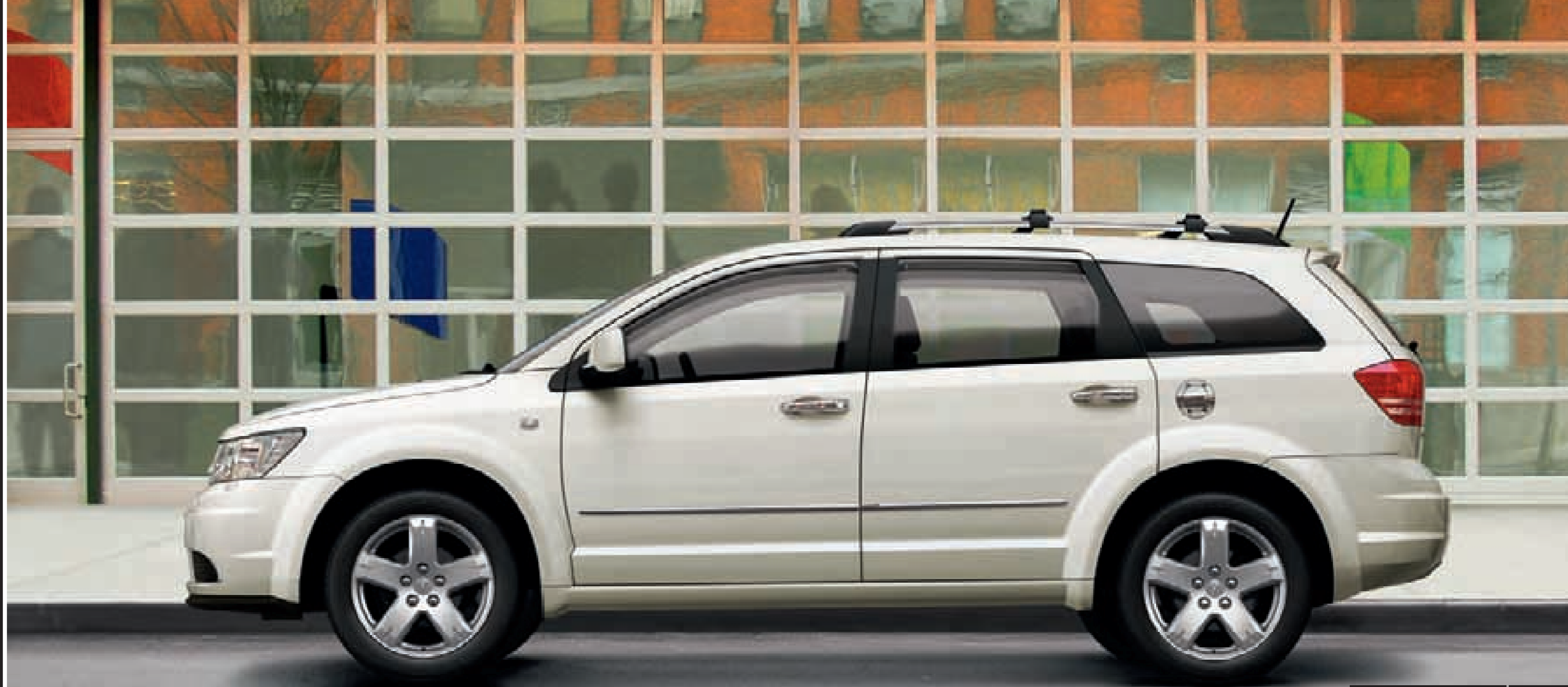
Modelo Journey R/T en Blanco Nieve

AUTÉNTICOS ACCESORIOS DODGE. Aporte a su modelo Journey un estilo y una protección que destaque sin renunciar al diseño, acabado y funcionalidad que ofrecen muchos de los accesorios de serie. Los auténticos accesorios Dodge de Mopar® que se muestran en la imagen derecha incluyen molduras laterales cromadas y un tapón de combustible cromado para darle una apariencia destacada y viva. Los deflectores de ventanilla proporcionan protección básica a la vez que aportan estilo.