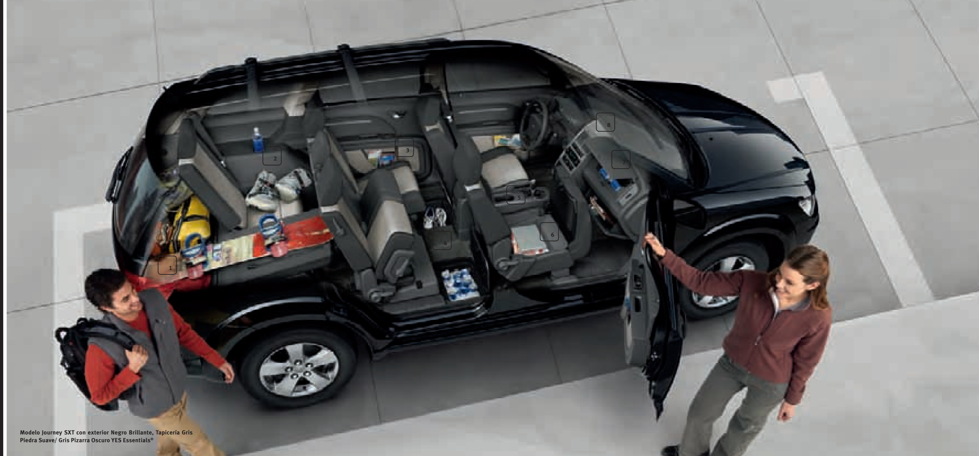
Modelo Journey SXT con exterior Negro Brillante, Tapicería Gris Piedra Suave/ Gris Pizarra Oscuro YES Essentials®

PANEL DE ALMACENAMIENTO. Un pequeño compartimento integrado es el trastero perfecto para esos objetos útiles que toda casa necesita.