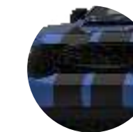
BLACK RED STRIPES