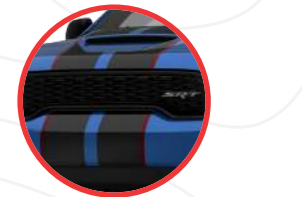
BLACK RED STRIPES