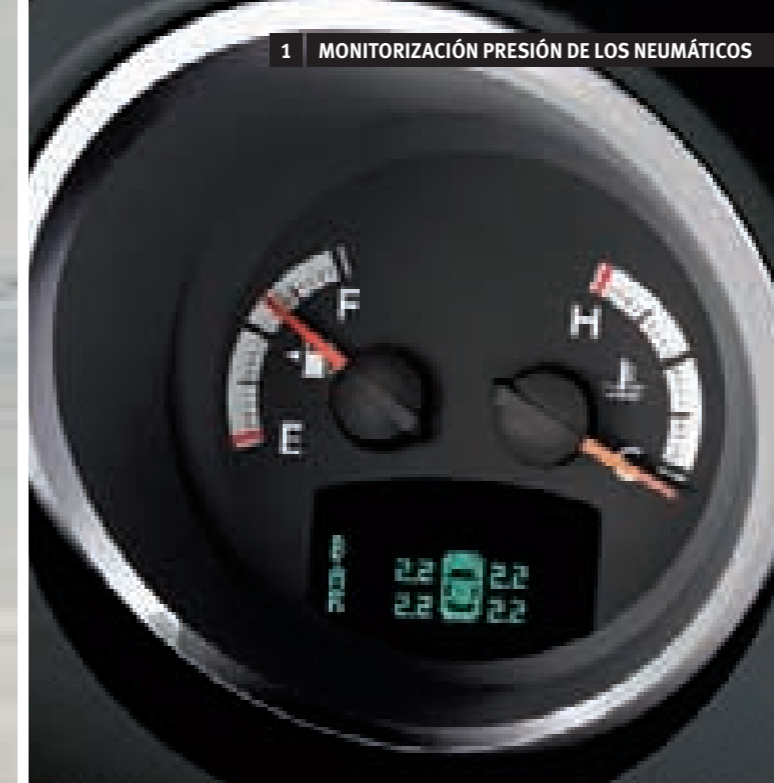
1 MONITORIZACIÓN PRESIÓN DE LOS NEUMÁTICOS

EL NITRO LE PROTEGE. Bajo el imponente diseño y atractivos colores del Dodge Nitro se ocultan avanzados sistemas y soluciones preparados para actuar cuando es necesario.