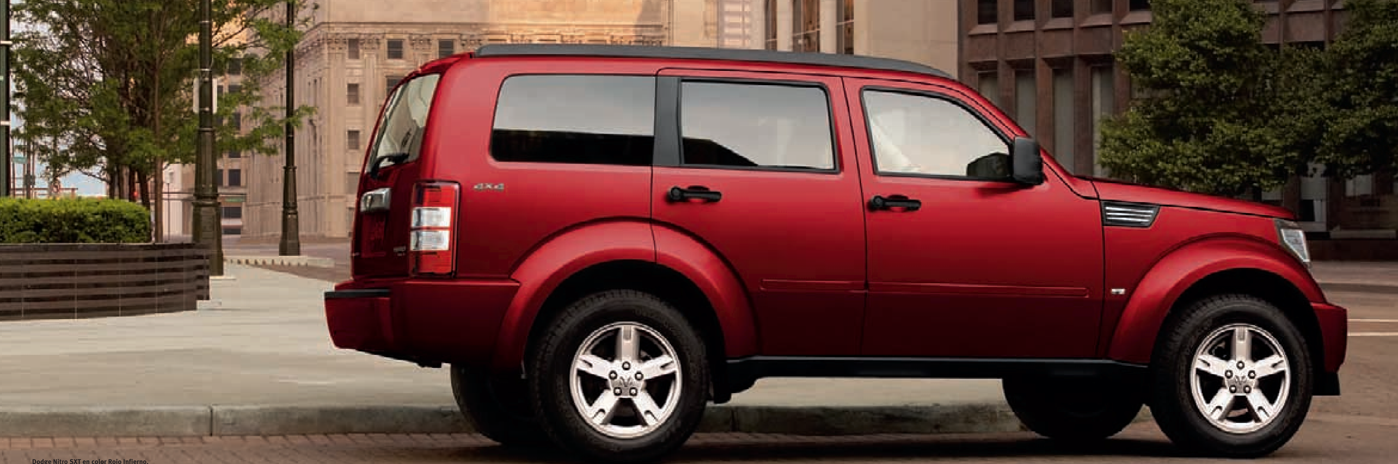
Dodge Nitro SXT en color Rojo Infierno.