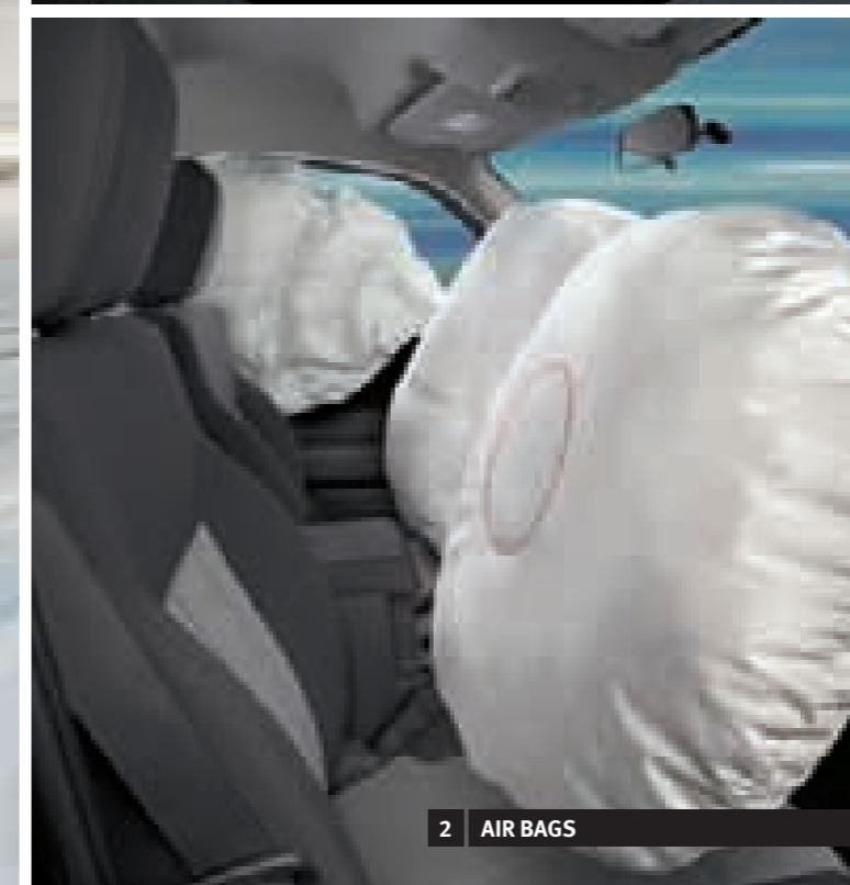
2 AIR BAGS

Nitro SE en color Azul Aguas Profundas (Bajo pedido).