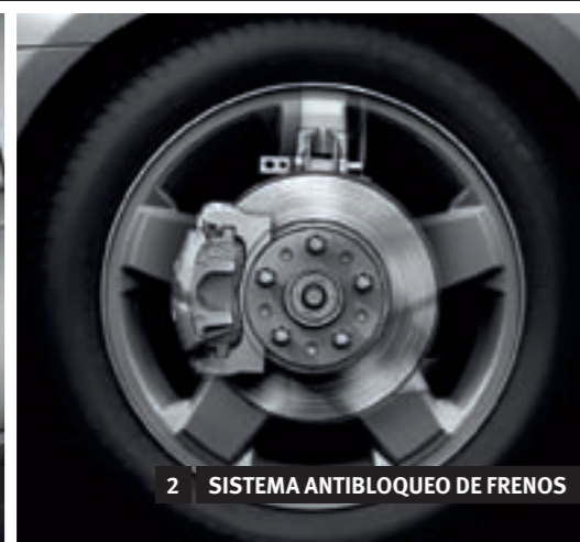
2 SISTEMA ANTIBLOQUEO DE FRENOS