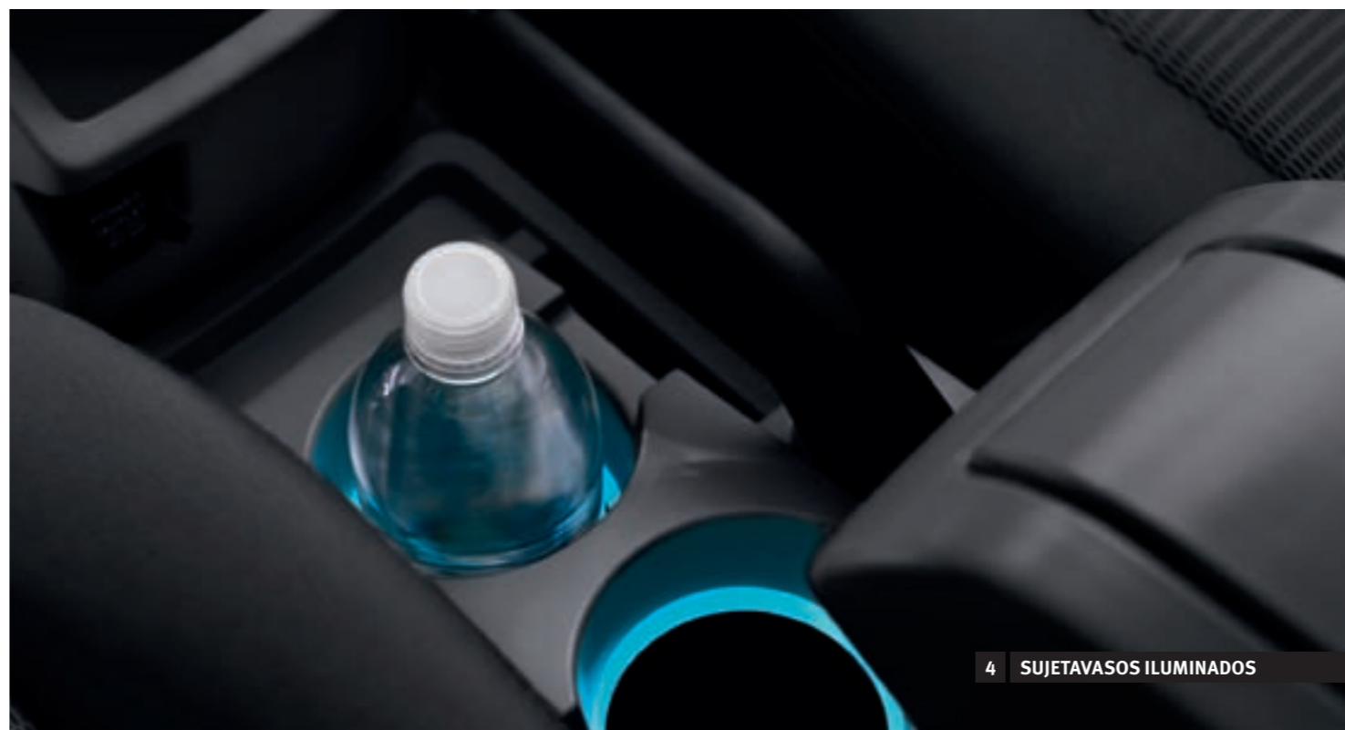
4 SUJETAVASOS ILUMINADOS