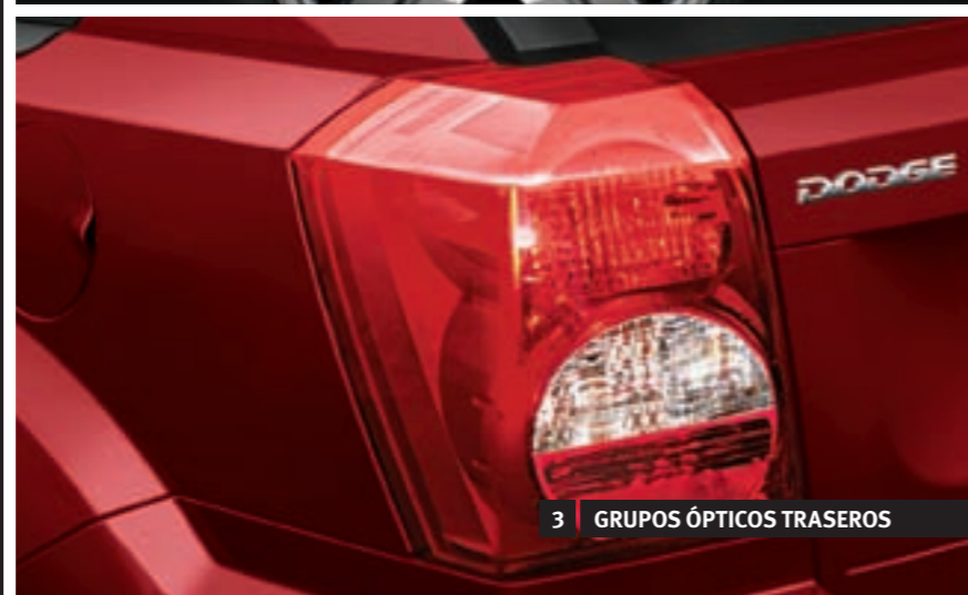
3 GRUPOS ÓPTICOS TRASEROS