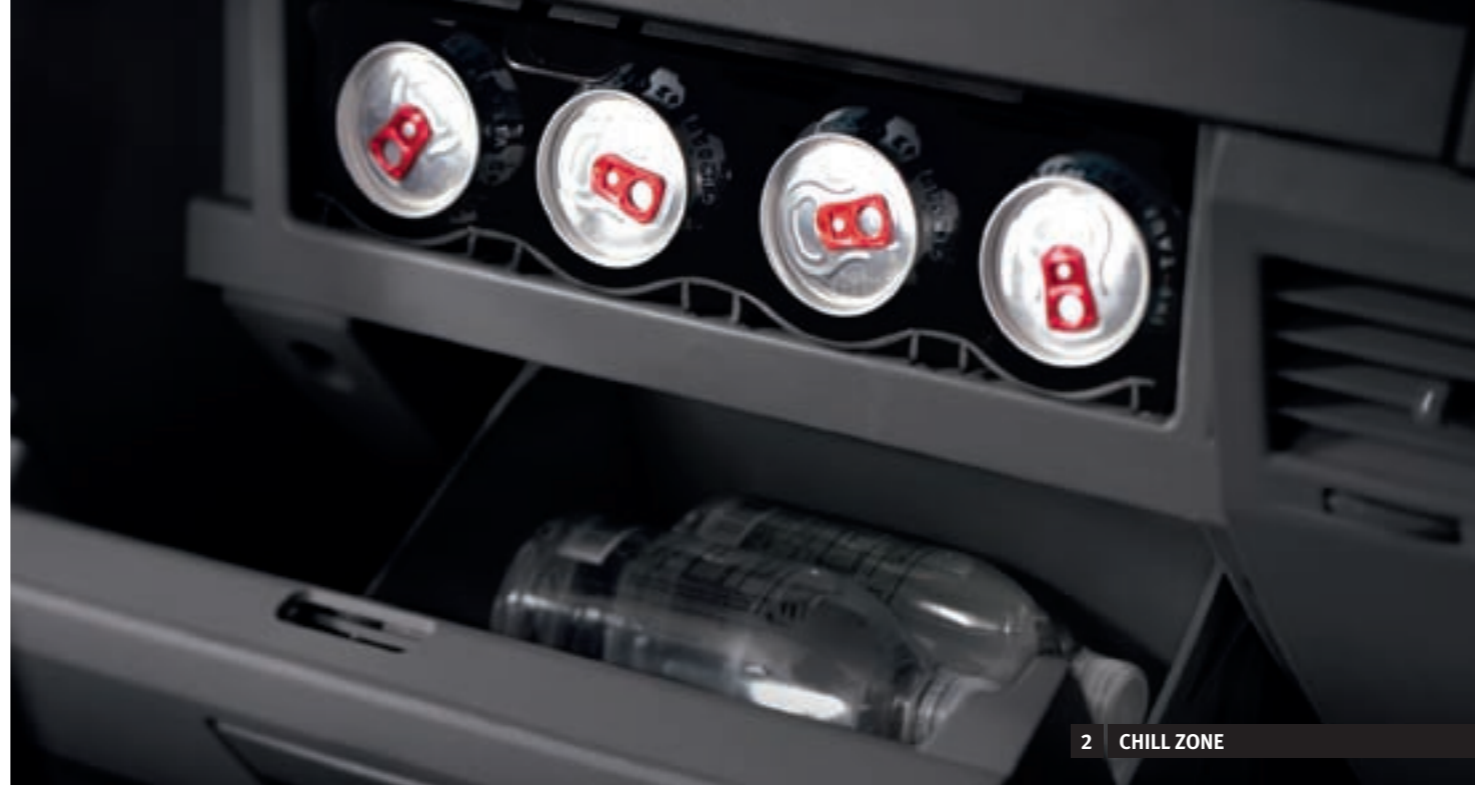
2 CHILL ZONE