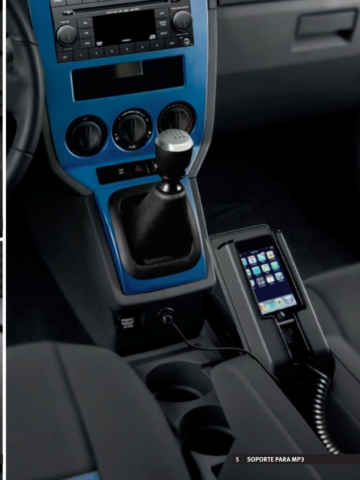
5 SOPORTE PARA MP3