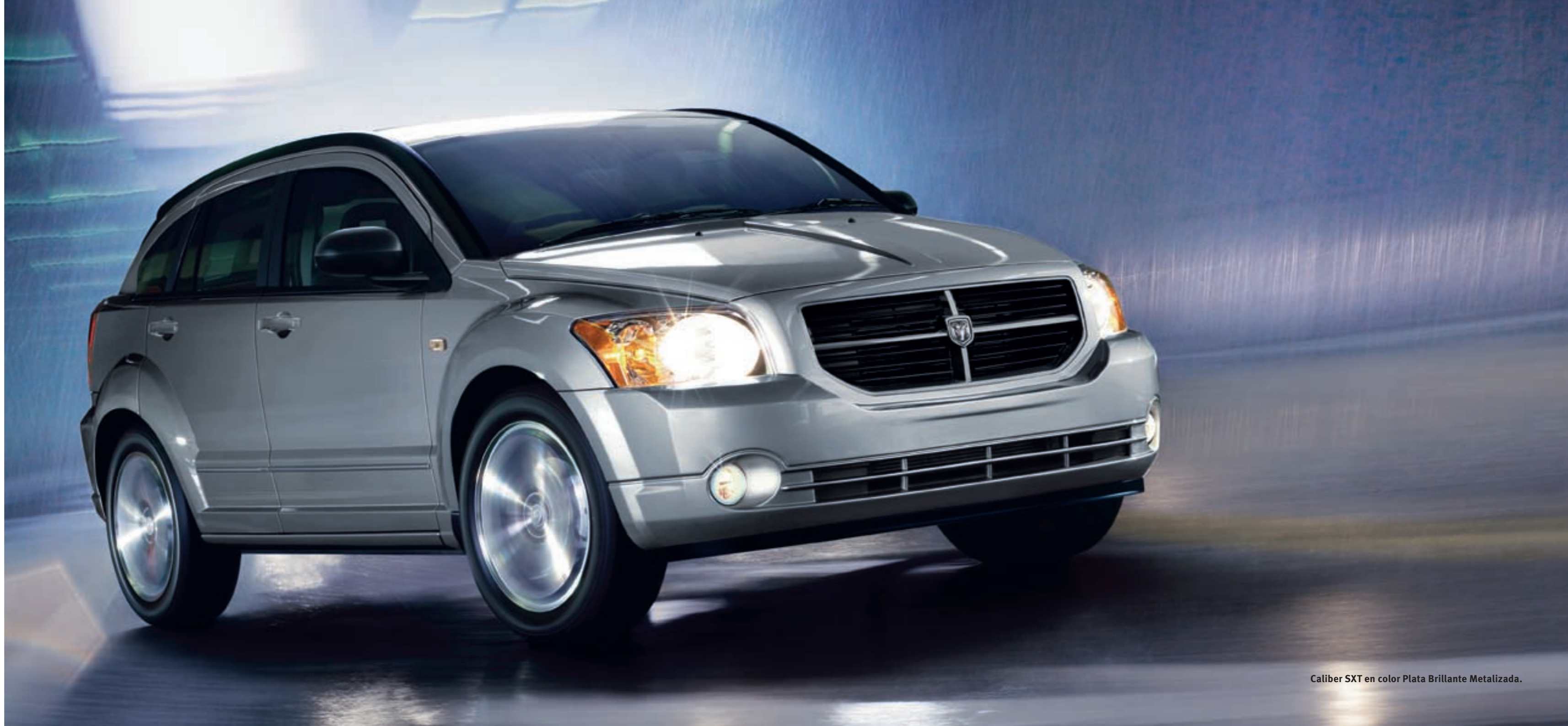
Caliber SXT en color Plata Brillante Metalizada.