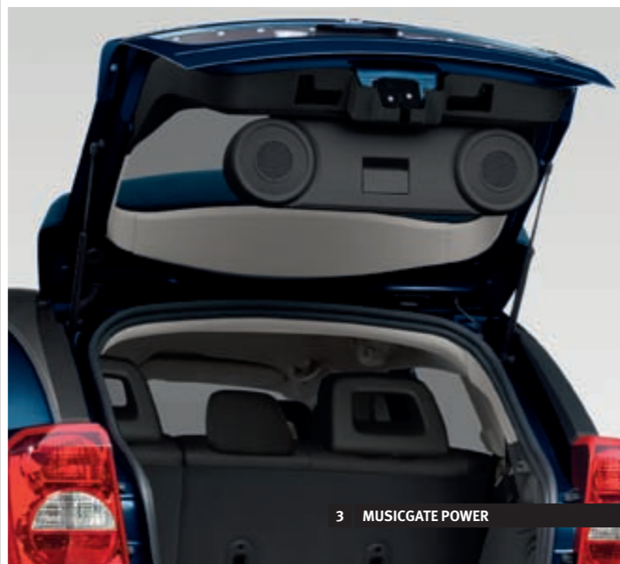
3 MUSICGATE POWER