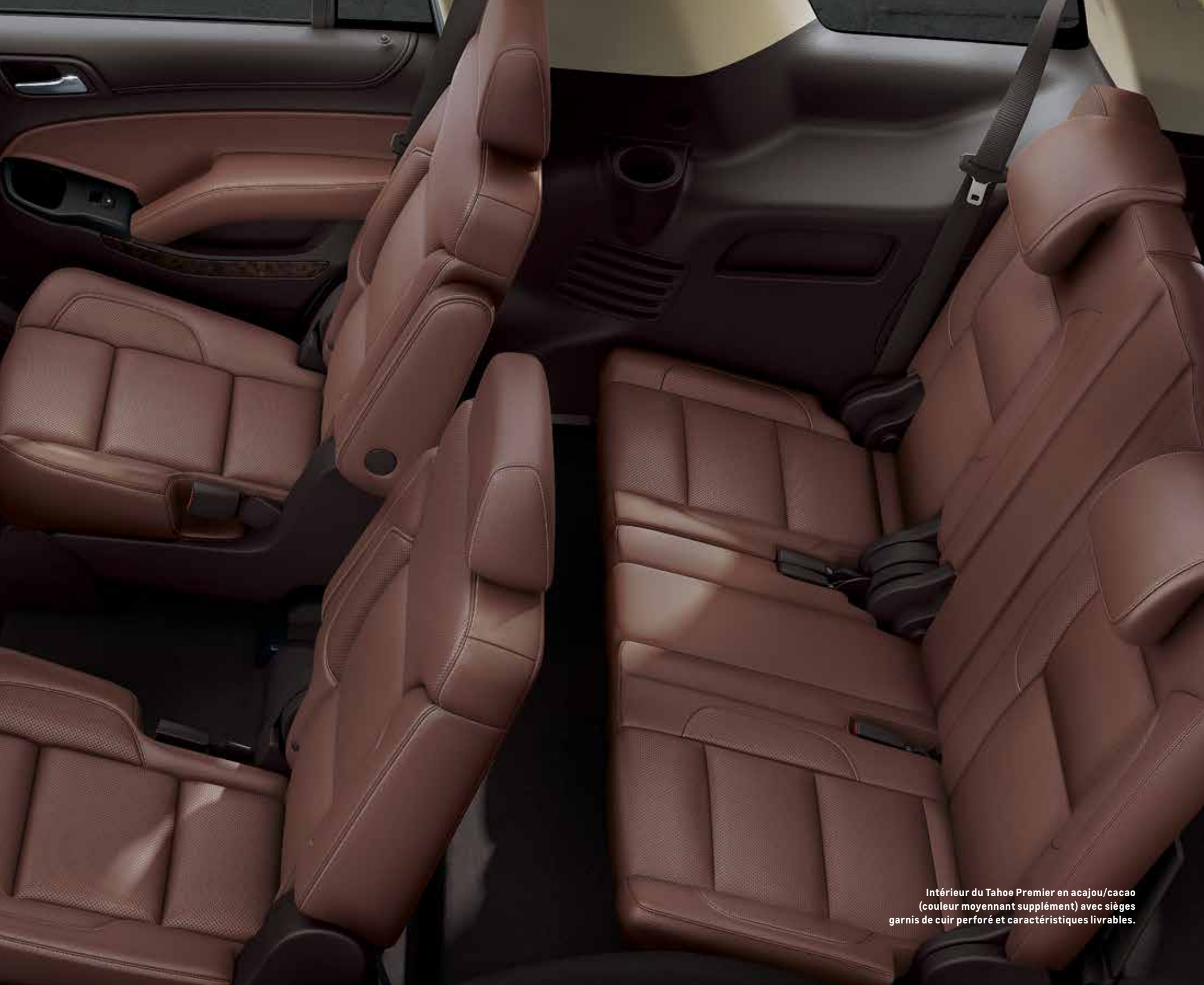
Intérieur du Tahoe Premier en acajou/cacao (couleur moyennant supplément) avec sièges garnis de cuir perforé et caractéristiques livrables.