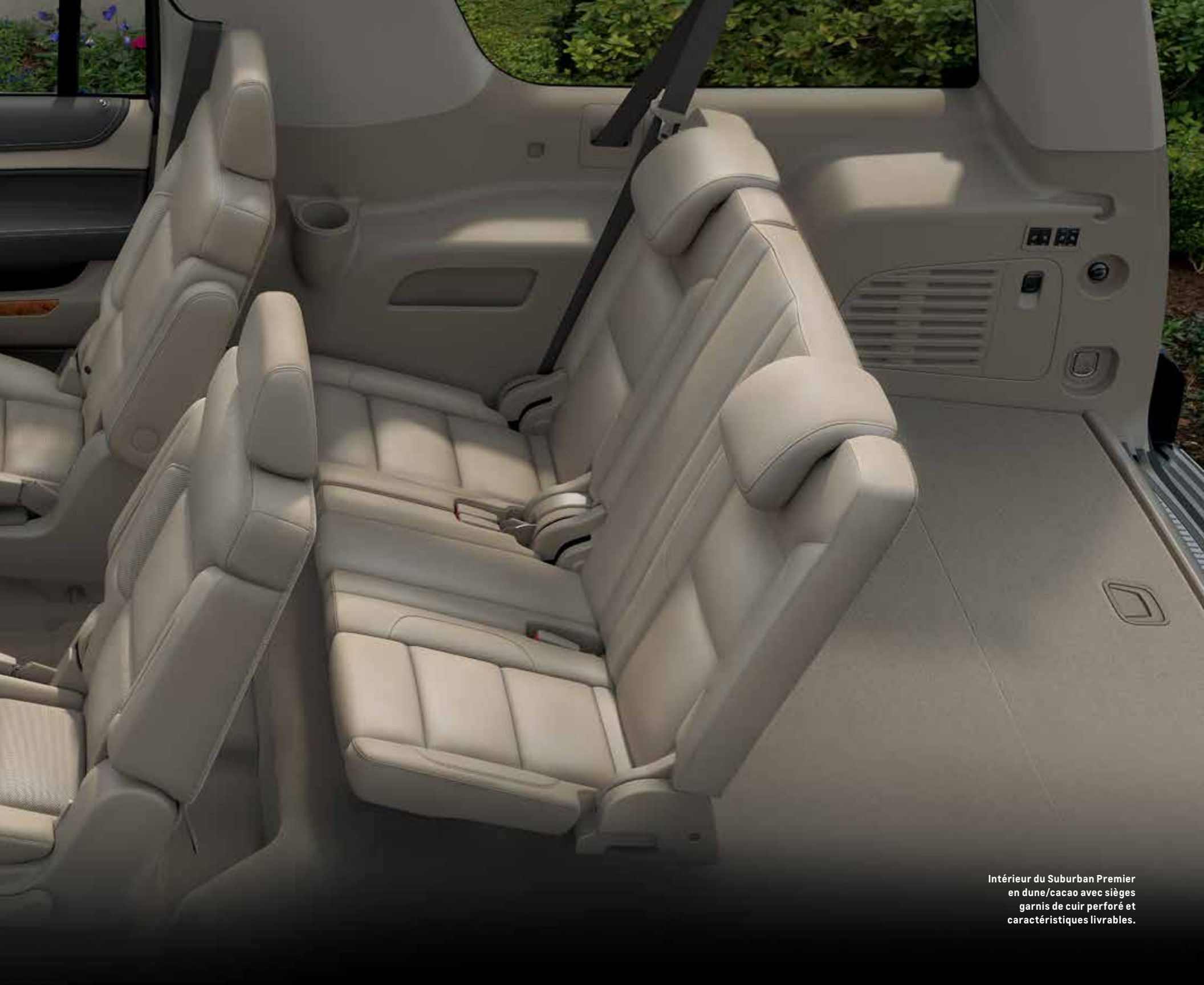
Intérieur du Suburban Premier en dune/cacao avec sièges garnis de cuir perforé et caractéristiques livrables.