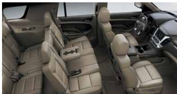
Tissu haut de gamme dune 7 avec garnitures contrastantes cacao