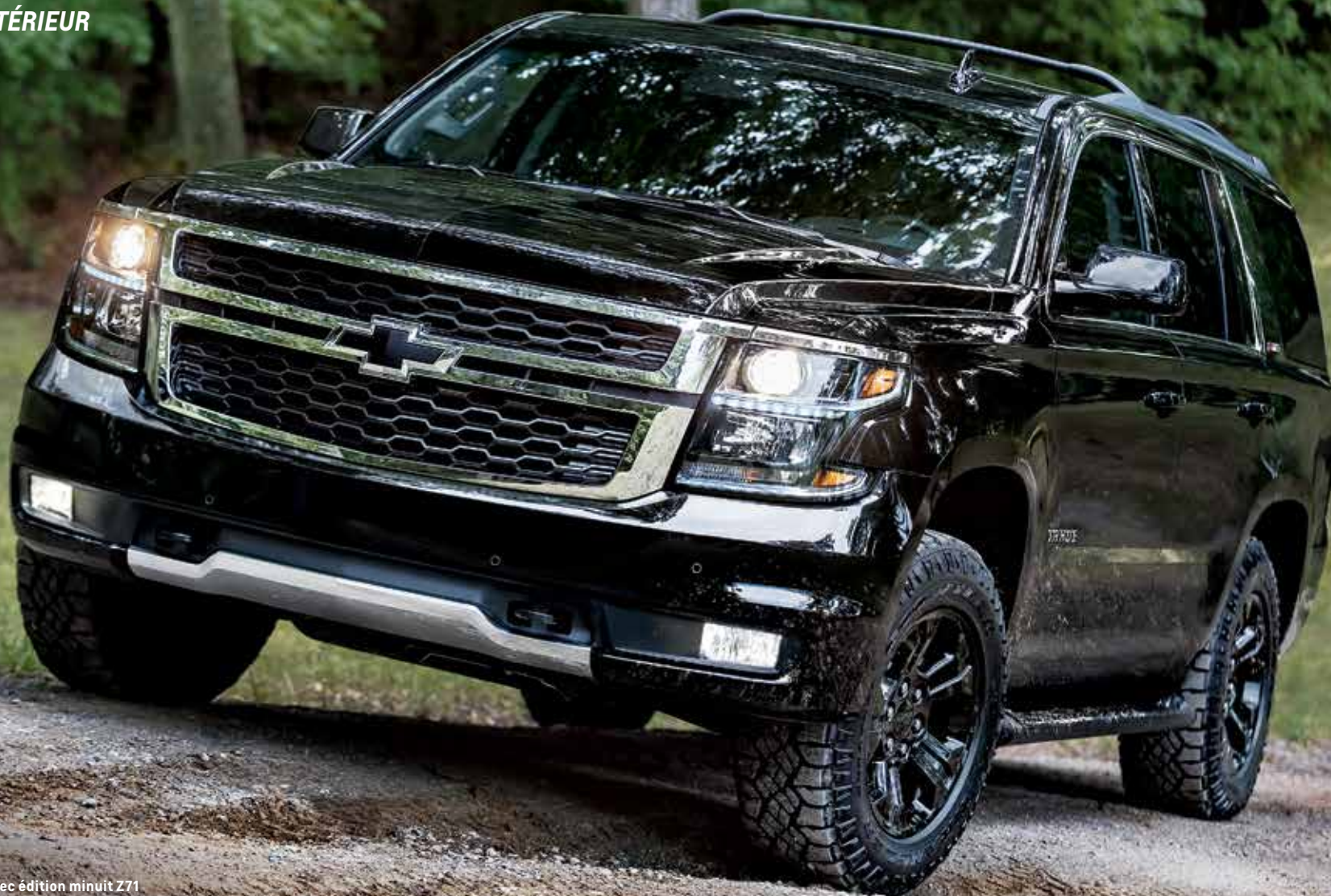
Tahoe LT en noir avec édition minuit Z71 livrable (disponibilité post-lancement).

LA LÉGENDE DU Z71. Avec sa suspension robuste, une boîte de transfert active Autotrac MC à deux vitesses, un filtre à air grande capacité, un rapport de pont arrière de 3,42, des plaques de protection et un contrôle de descente, le groupe tout terrain Z71 livrable peut vous mener à destination, aussi loin soit-elle. Il comprend aussi des crochets