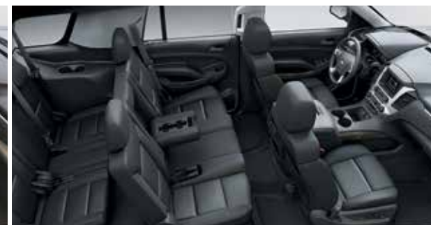
Tissu haut de gamme noir jais 7 avec garnitures contrastantes noir jais