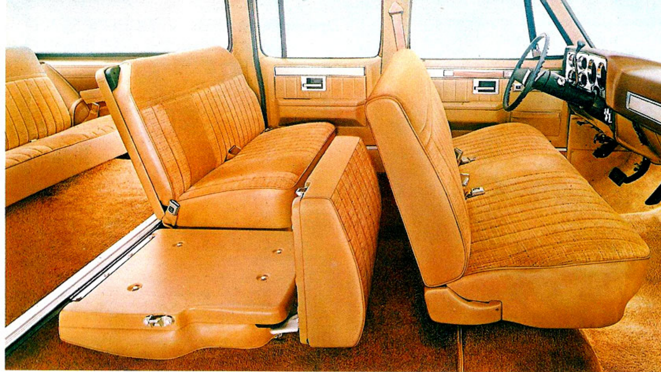
Intérieur Silverado représenté en amande moyen.