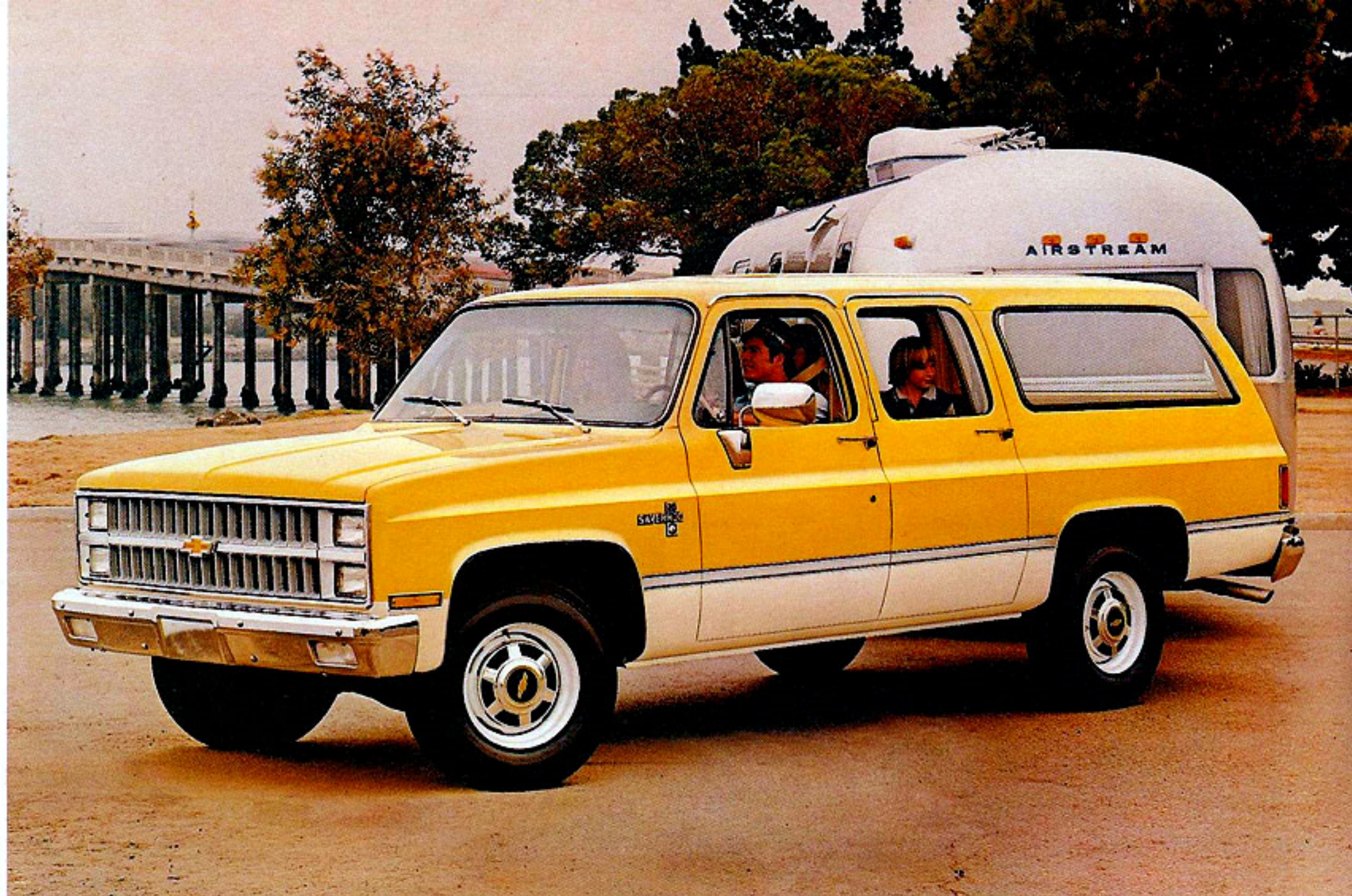
Suburban C20 Silverado représenté en jaune colonial et amande.

(En page couverture) Suburban C10 Silverado diesel représenté en bleu minuit et bleu clair métallisé.