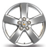
Jantes 17" Alliage