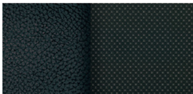
Sellerie mixte tissu / cuir de synthèse