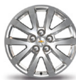
Jantes 18" Alliage