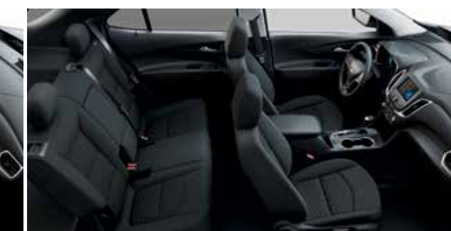
Tissu haut de gamme noir jais avec garnitures contrastantes noir jais 10