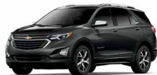
G7Q - GRIS NIGHTFALL MÉTALLISÉ 1