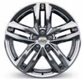
19 po en aluminium usiné ultra brillant avec évidements peints argent scintillant (livrables pour Premier) 1