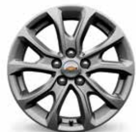
17 po en aluminium peint (de série pour LS et LT)