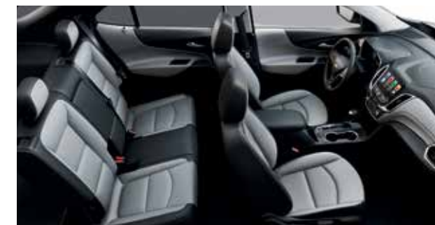
Cuir perforé gris cendré moyen avec garnitures contrastantes noir jais 7