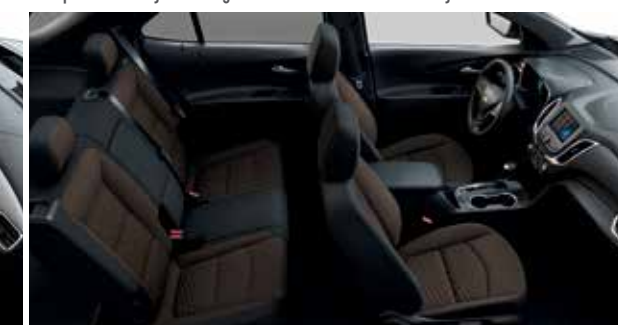
Tissu haut de gamme cannelle avec garnitures contrastantes noir jais 9,10