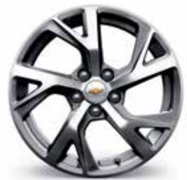
18 po en aluminium fini usiné avec évidements peints (de série pour Premier)