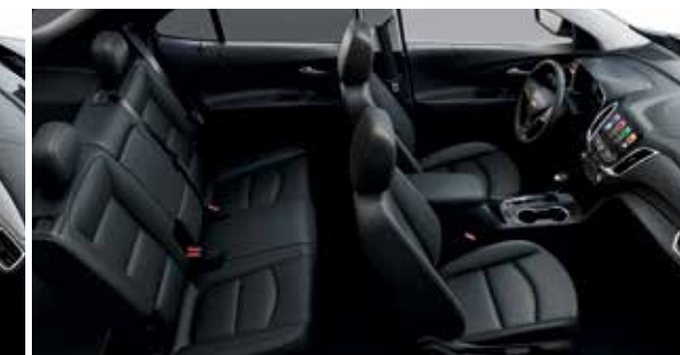
Cuir perforé noir jais avec garnitures contrastantes noir jais 7