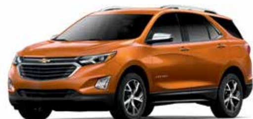
GGQ - ROUGE ORANGÉ MÉTALLISÉ 1,3