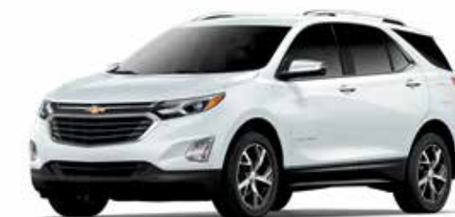
GAZ - BLANC SOMMET