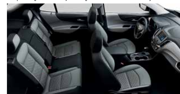
Tissu haut de gamme gris cendré moyen avec garnitures contrastantes noir jais 9,10