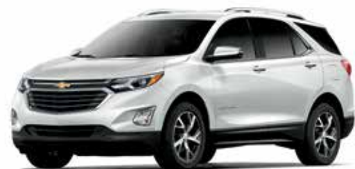
G1W - NACRE IRISÉ TRIPLE COUCHE 1,2,3