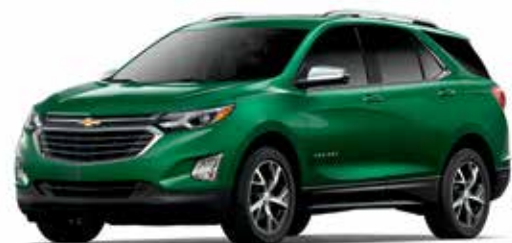
G8U - VERT LIERRE MÉTALLISÉ 1,3,4,6