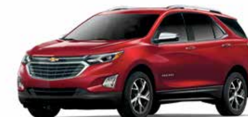
GPJ - TEINTE ROUGE CAJUN 1,2,5,6

1 Livrable moyennant supplément. 2 Non livrable pour LS. 3 Non livrable pour LT diesel ou Premier diesel. 4 Disponibilité post-lancement. 5 Exige et livrable uniquement avec le moteur turbodiesel de 1,6 L. 6 Non livrable avec intérieur noir jais/cannelle ou noir jais/cognac. 7 De série pour Premier. 8 Non livrable avec couleur extérieure récif sablonneux métallisé, vert lierre métallisé ou teinte rouge cajun. 9 De série pour LS. 10 De série pour LT.