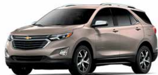
G8K - RÉCIF SABLONNEUX MÉTALLISÉ 1,4