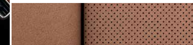
Cuir perforé cognac avec garnitures contrastantes noir jais 7,8