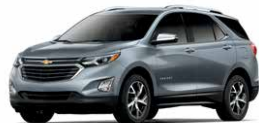
G9K - ACIER SATINÉ MÉTALLISÉ 1,4,5