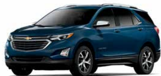
G35 - BLEU ORAGE MÉTALLISÉ 1,4,5