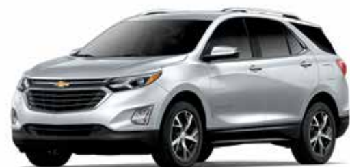
GAN - ARGENT GLACÉ MÉTALLISÉ