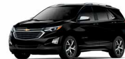
GB8 - NOIR MOSAÏQUE MÉTALLISÉ 1,2