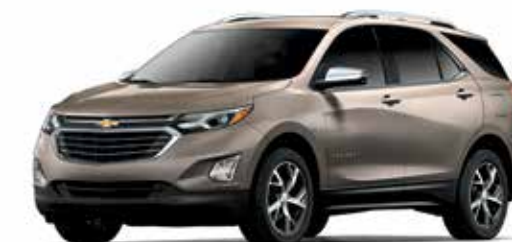
GMU - GRIS PEPPERDUST MÉTALLISÉ 1,4,5,6