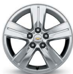
16 po en aluminium (de série pour LS à TI et LT)