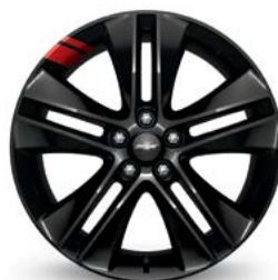
17 po en aluminium peint en noir avec traits hachurés rouges (livrable pour LT avec édition Série Distinction)