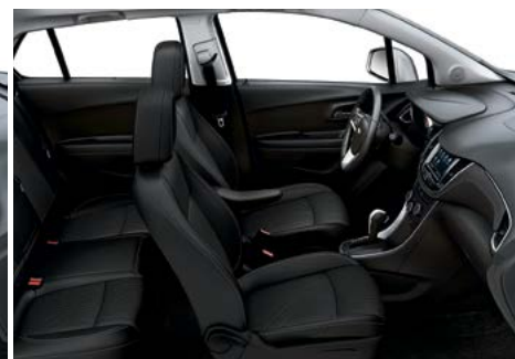
Tissu de luxe/similicuir noir jais avec garnitures contrastantes noir jais 3