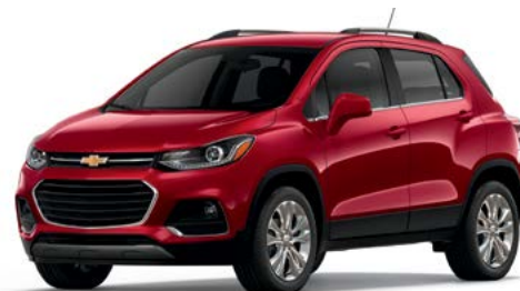
GPJ - TEINTE ROUGE CAJUN 1,2