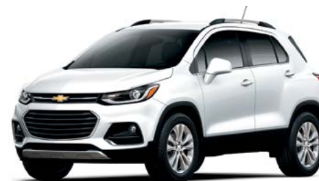
GAZ - BLANC SOMMET