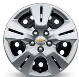
16 po en acier avec enjoliveur de roue (de série pour LS à TA)