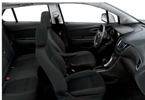
Tissu noir jais avec garnitures contrastantes noir jais 1