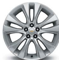
18 po en aluminium (de série pour Premier)

1 Non livrable pour LS. 2 Livrable moyennant supplément. 3 Non livrable avec intérieur noir jais/cognac.