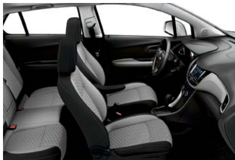
Tissu gris cendré clair avec garnitures contrastantes noir jais 1