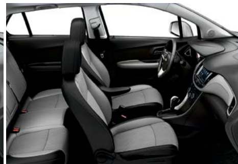
Tissu de luxe/similicuir gris cendré clair avec garnitures contrastantes noir jais 5