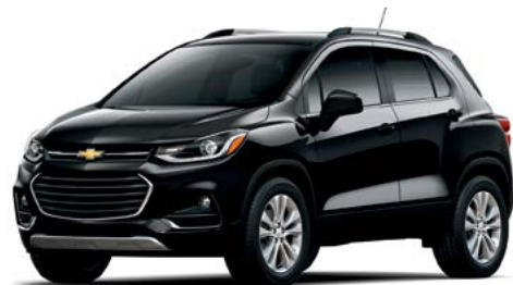
GB8 - NOIR MOSAÏQUE MÉTALLISÉ 2