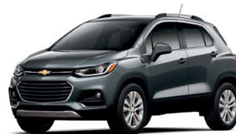
G7Q - GRIS NIGHTFALL MÉTALLISÉ 1,2