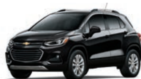
GB8 - NOIR MOSAÏQUE MÉTALLISÉ 2