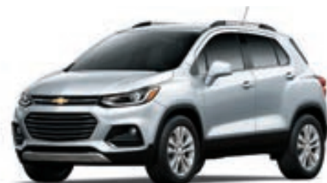
GAN - ARGENT GLACÉ MÉTALLISÉ 3