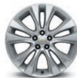
18 po en aluminium (de série pour Premier)