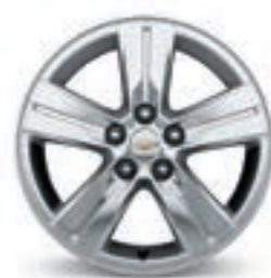
16 po en aluminium (de série pour LS à TI et LT)