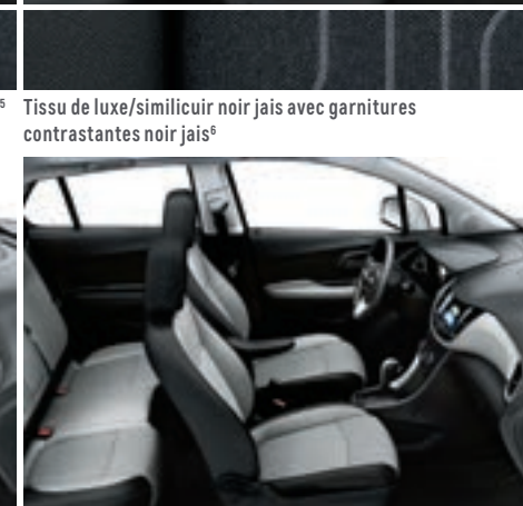
Tissu de luxe/similicuir gris cendré clair avec garnitures contrastantes noir jais 6