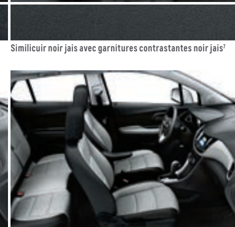
Similicuir gris cendré clair avec garnitures contrastantes noir jais 7