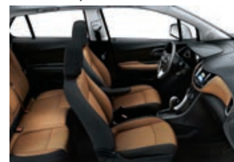
Tissu de luxe cognac avec garnitures contrastantes noir jais 5