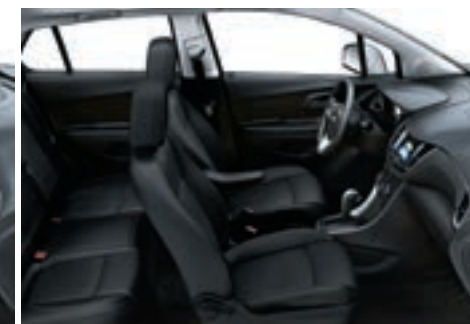
Tissu de luxe/similicuir noir jais avec garnitures contrastantes noir jais 6