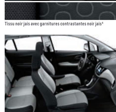
Tissu gris cendré clair avec garnitures contrastantes noir jais 4