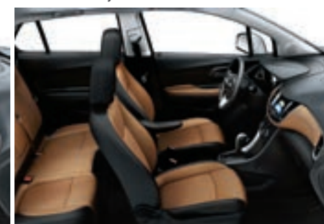
Tissu de luxe/similicuir cognac avec garnitures contrastantes noir jais 6