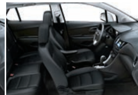
Similicuir noir jais avec garnitures contrastantes noir jais 7