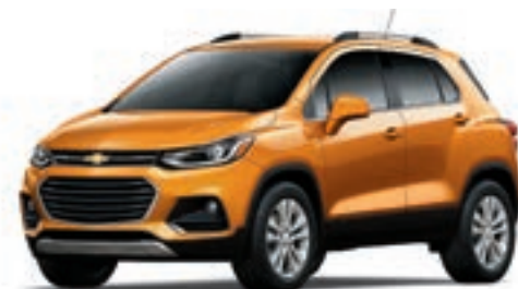
GGQ - ROUGE ORANGÉ MÉTALLISÉ 1,2