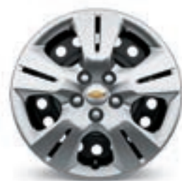
16 po en acier avec enjoliveur de roue (de série pour LS à TA)