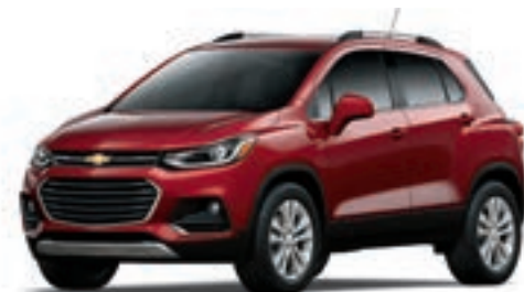
G7T - CRAMOISI MÉTALLISÉ 2