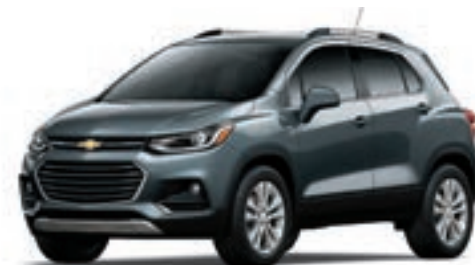
G7Q - GRIS NIGHTFALL MÉTALLISÉ 1,2