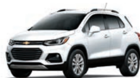
GAZ - BLANC SOMMET