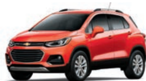
G7C - ROUGE ARDENT 1