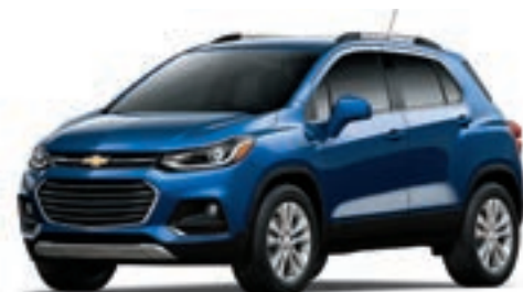
GTS - BLEU TOPAZE MÉTALLISÉ 2,3