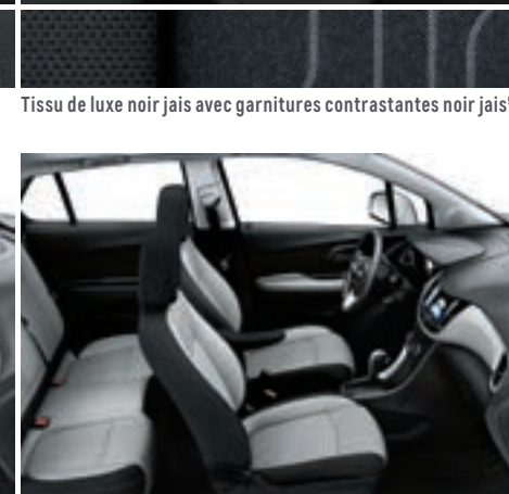
Tissu de luxe gris cendré clair avec garnitures contrastantes noir jais 5