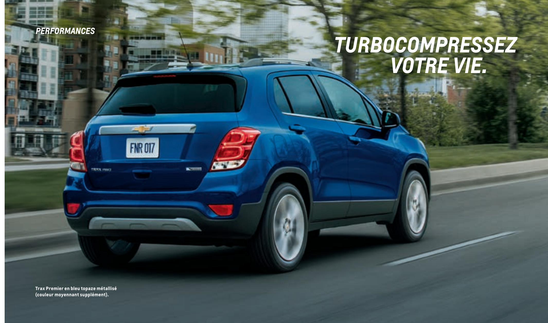
Trax Premier en bleu topaze métallisé (couleur moyennant supplément).

PERFORMANCES DU TURBO. La puissance nécessaire pour vous glisser dans la circulation et dépasser sans souci vient du moteur turbocompressé ECOTEC MD de 1,4 L de série, couplé à une boîte manuelle six vitesses ou une boîte automatique six vitesses à commande électronique livrable.