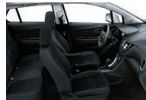
Tissu noir jais avec garnitures contrastantes noir jais 4