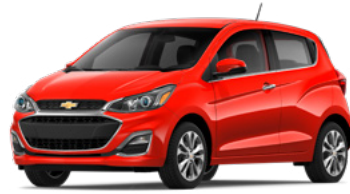
GG2 – Rouge ardent