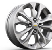
15 po en aluminium peint argent (1LT et 2LT)