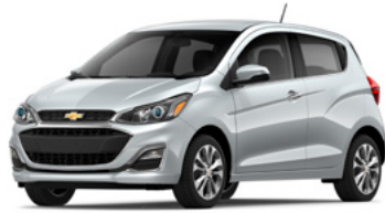
GAN – Argent glacé