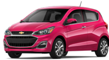
GU0 – Framboise 1