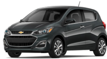
GK2 – Gris Nightfall 1