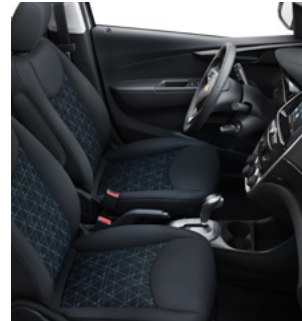
Tissu noir jais 3