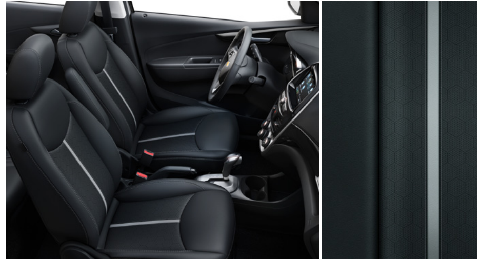
Similicuir noir jais avec bande et garnitures contrastantes argent Anderson foncé 2