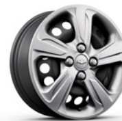
15 po en acier avec enjoliveurs boulonnés (LS)