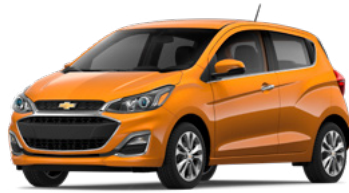
GL5 – Orange 1