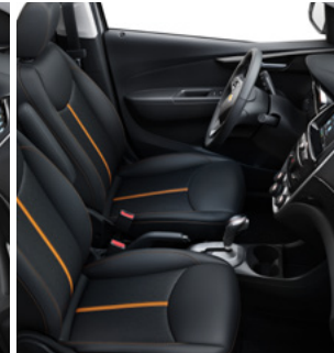
Similicuir noir jais avec bande et garnitures contrastantes orange 4