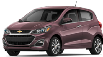
GHN – Fruit de la passion 1