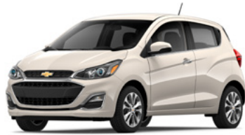
GV8 – Guimauve grillée 1