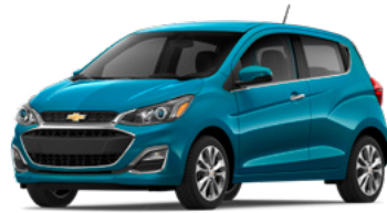
GZ0 – Bleu Caraïbes 1