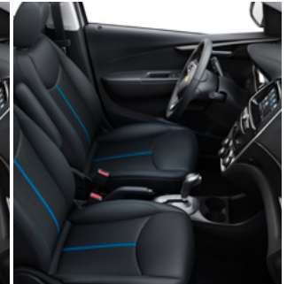
Similicuir noir jais avec bande et garnitures contrastantes bleu Caraïbes 5