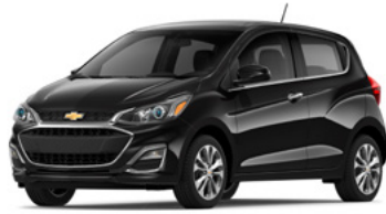
GB0 – Noir mosaïque 1