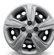
15 po en acier avec enjoliveurs boulonnés (de série pour LS)