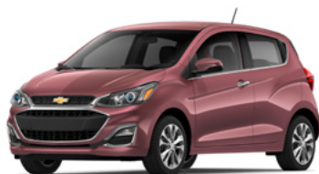
GHN – Fruit de la passion