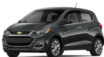
GK2 – Gris Nightfall