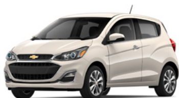
GV8 – Guimauve grillée