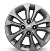
15 po en aluminium peint argent (de série pour 1LT et 2LT)