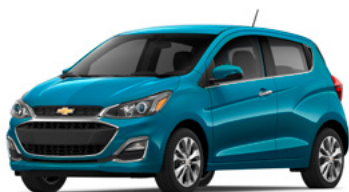
GZ0 – Bleu Caraïbes 1