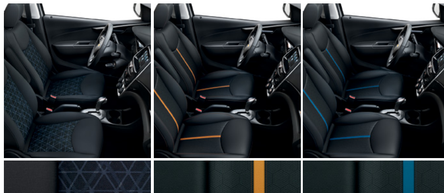
Tissu noir jais avec garnitures contrastantes argent Anderson foncé 3