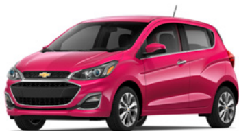
GU0 – Framboise