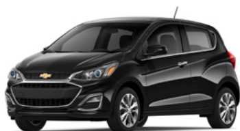
GB0 – Noir mosaïque