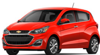
GG2 – Rouge ardent