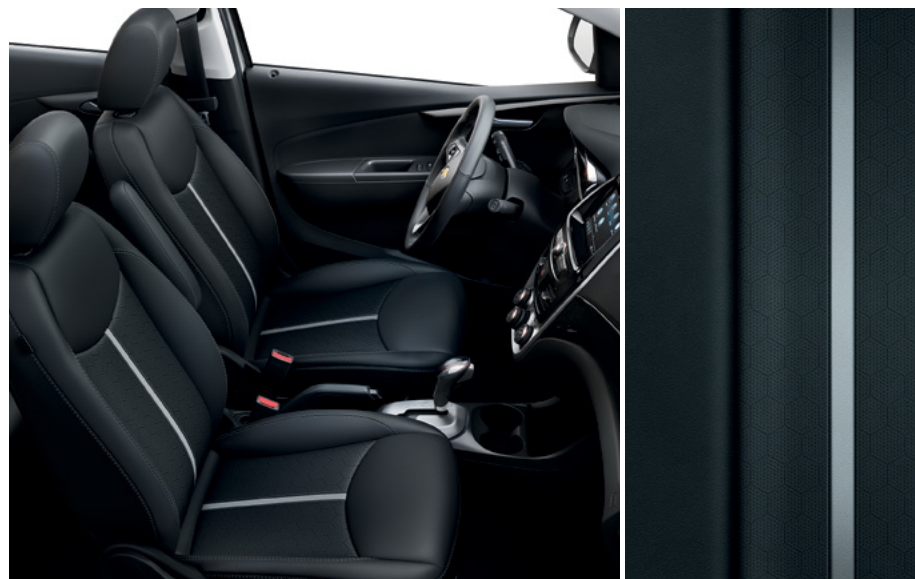
Similicuir noir jais avec bande et garnitures contrastantes argent Anderson foncé 2