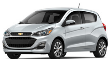
GAN – Argent glacé