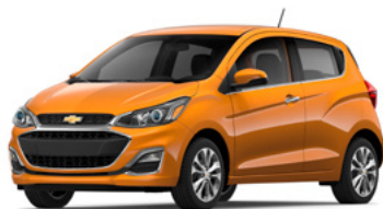
GL5 – Rouge orangé 1