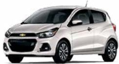
GV8 - GUIMAUVE GRILLÉE