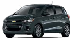
GK2 - GRIS NIGHTFALL