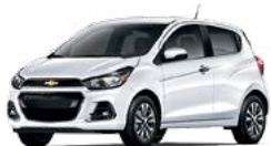
GAZ - BLANC SOMMET