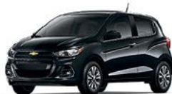
GB0 - NOIR MOSAÏQUE