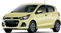
GN6 - SOUFRE 3