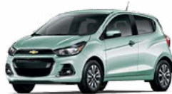
GP9 - MENTHE 3