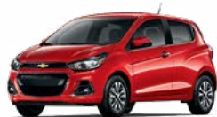
GG2 - ROUGE ARDENT