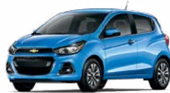
GW7 - SPLASH