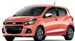
G32 - SORBET 1,2