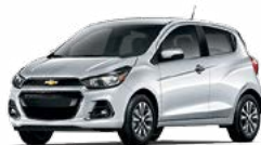
GAN - ARGENT GLACÉ