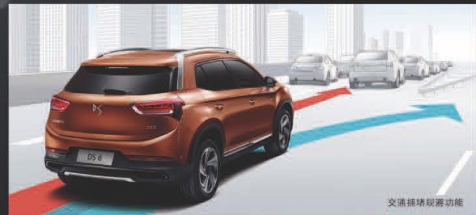
交通拥堵规避功能