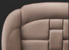
棕色NAPPA+ SEMI ANILINE 顶级真皮