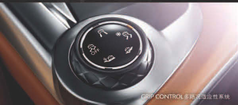
GRIP CONTROL多路况适应性系统