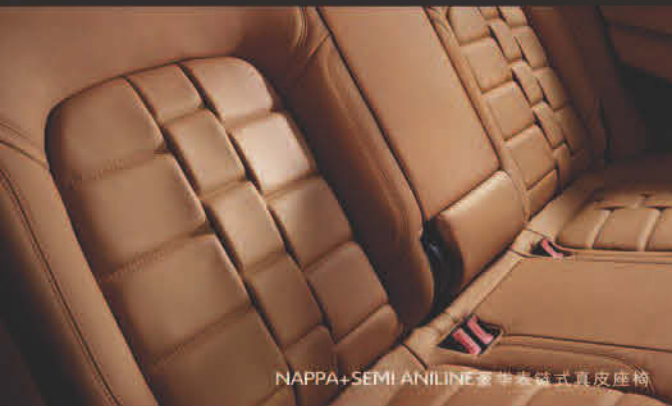
NAPPA+SEMI ANILINE豪华表链式真皮座椅