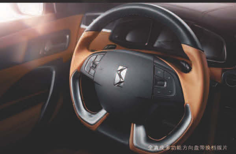
全真皮多功能方向盘带换挡拨片