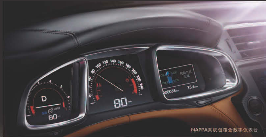
NAPPA真皮包覆全数字仪表台