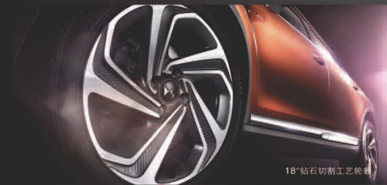
18" 钻石切割工艺轮毂