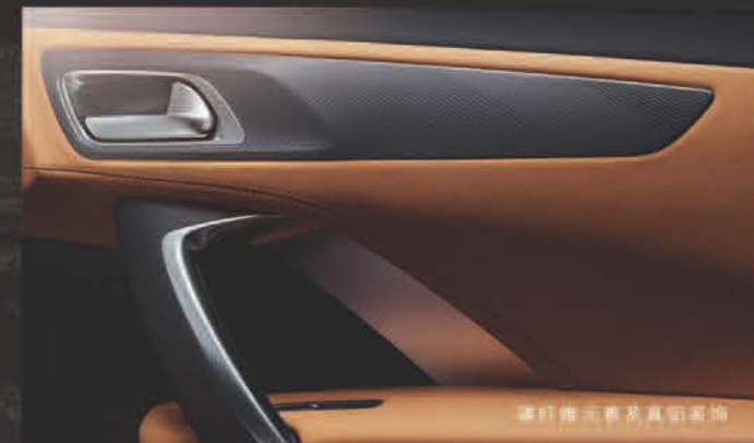
碳纤维元素及真铝装饰