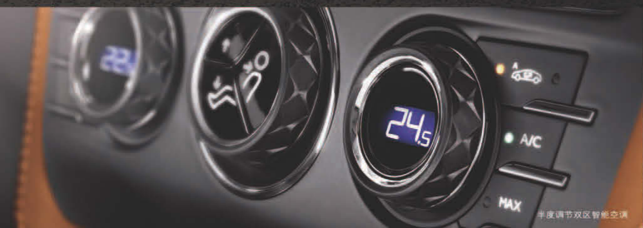
半度调节双区智能空调