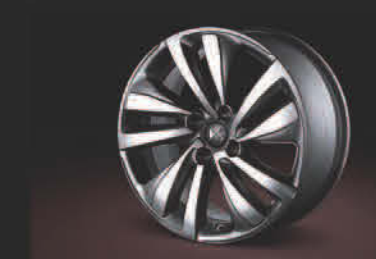
17" BRILLANT 钻石切割铝合金轮毂