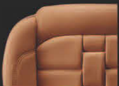
橙色NAPPA+ SEMI ANILINE 顶级真皮