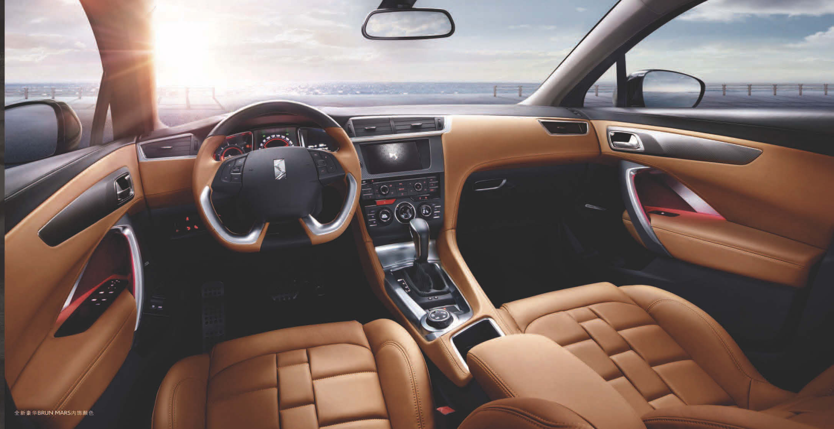
全新豪华BRUN MARS内饰颜色

全新豪华BRUN MARS内饰颜色，大胆设计构建现代艺术典范 NAPPA+SEMI ANILINE豪华表链式真皮座椅，严选无瑕疵顶级牛皮，诠释尊贵风范 碳纤维元素及真铝装饰，质感交错不失和谐 天生优雅，自成美学定律