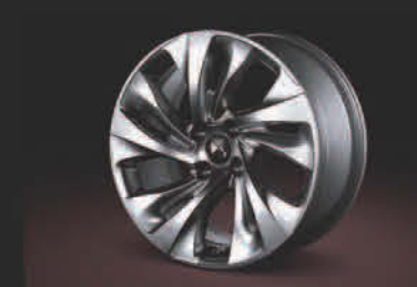
17" SALSA 铝合金轮毂