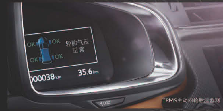
TPMS主动四轮胎压监测