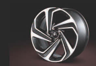
18" TWIST 钻石切割铝合金轮毂