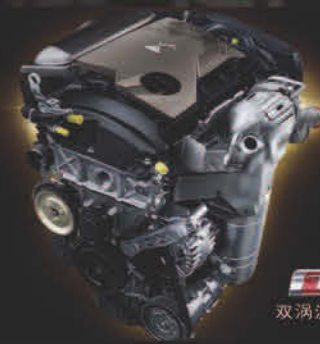
1.8 THP 200 双涡轮增压引擎

更有START/STOP一键收放澎湃马力，一念之间风驰电掣，弹指间，优雅之心已取野性前行。