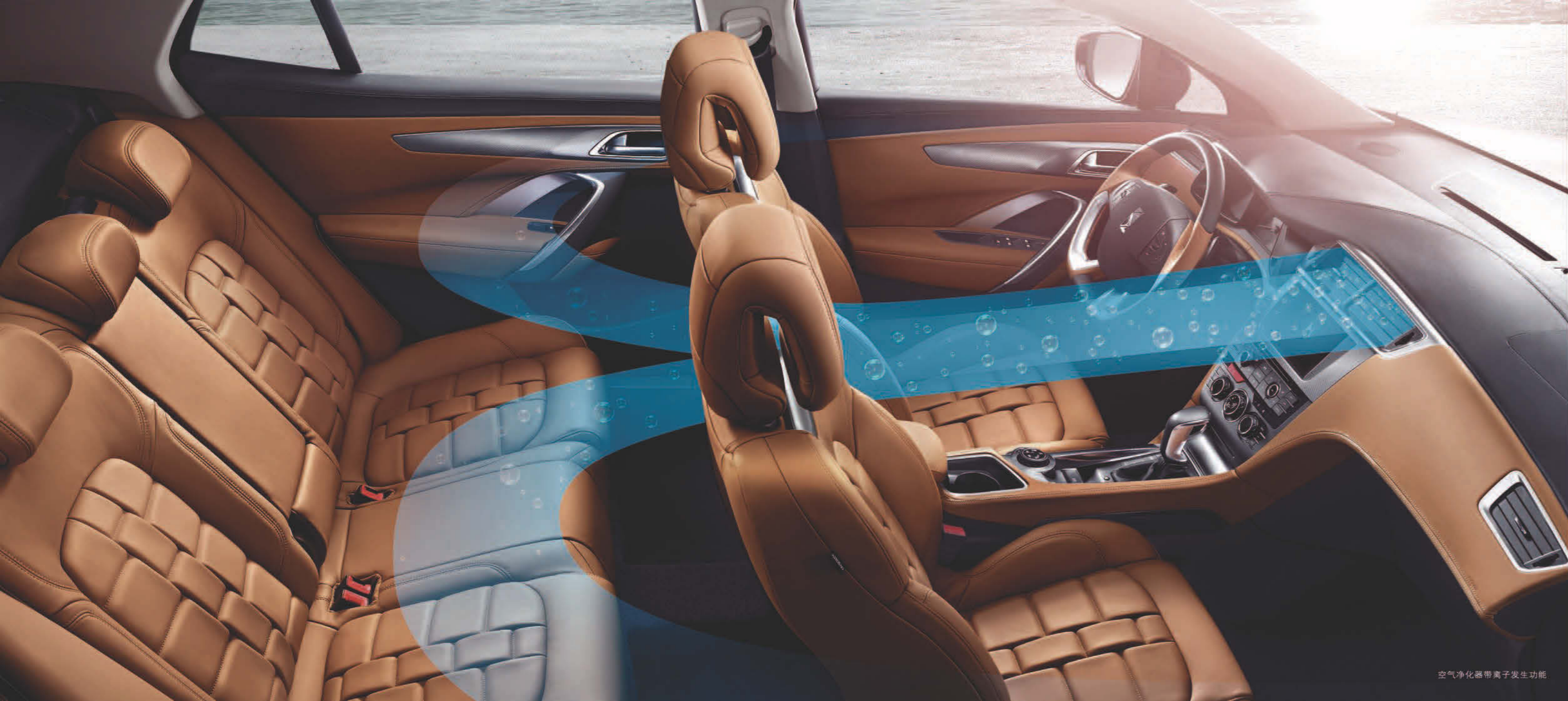
空气净化器带离子发生功能