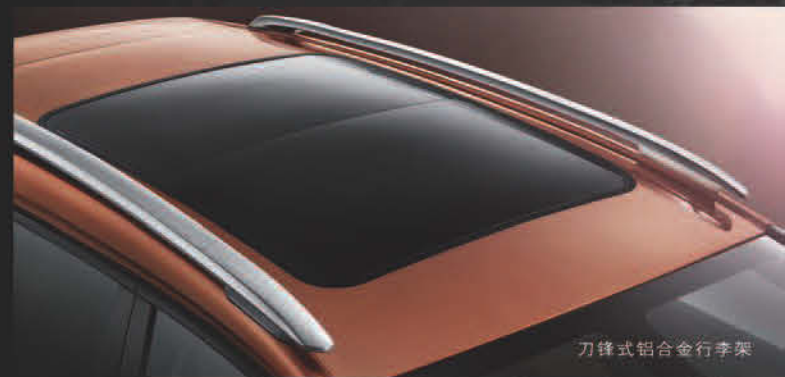
刀锋式铝合金行李架