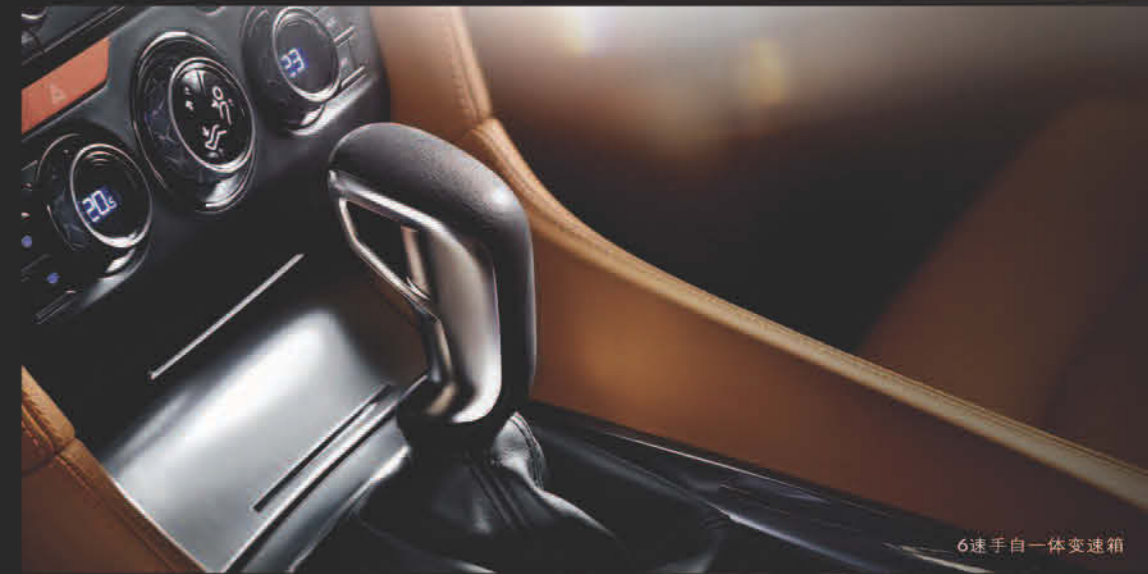
6速手自一体变速箱