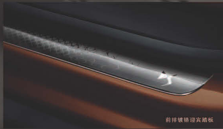
前排镀铬迎宾踏板