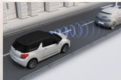
アクティブシティブレーキ作動イメージ

シフトレバーをバックに入れると、テールゲートに設置されたバックカメラにより、車両後方の状況をタッチスクリーンに映し出します。距離や角度が認識できるガイドラインにより、停車状況を正確に把握することが可能です。