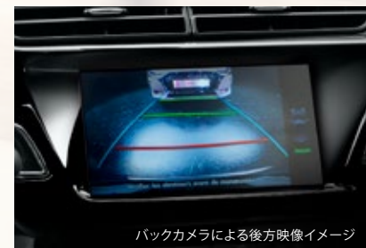
バックカメラによる後方映像イメージ

※アクティブシティブレーキは、低速走行時の追突の危険回避または被害軽減を目的としたシステムであり、追突などを自動回避するものではありません。制御には限界があり、道路状況や天候などによっては作動しない場合がありますのでシステムを過信することなく、お客様ご自身でつねに安全運転を心がけてください。また本システムは車両から約10m前方までの交通状況を検知しますが、二輪車、歩行者や小型の障害物などは検知しません。詳細については、DS正規販売店までお問い合わせください。