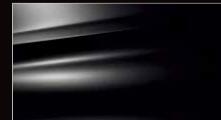
ノール ペルラネラ