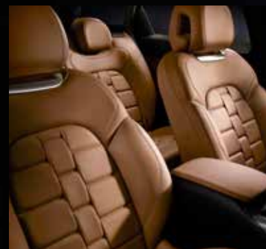
クラブレザーシート(セミアニリンレザー) フォヴ