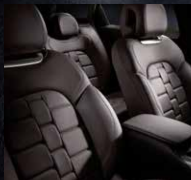
クラブレザーシート(セミアニリンレザー) クリオロ