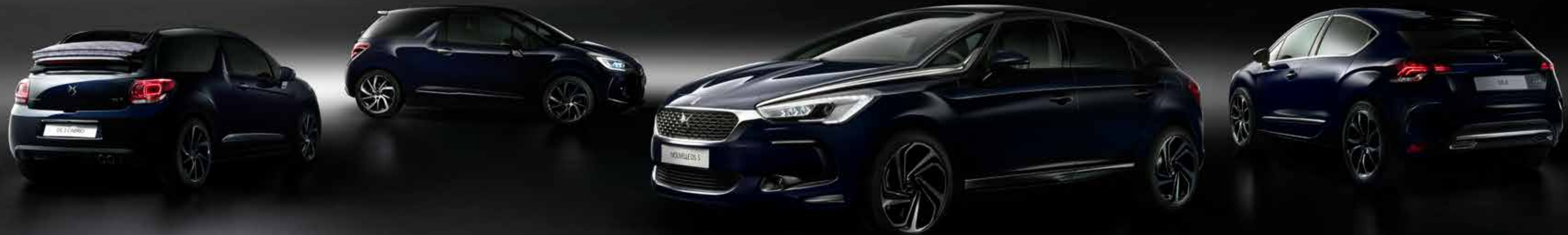
EDITION 1955 欧州仕様車

クルマに乗ることの喜びを、もっと強く、深く。自由を旨とする国の、芸術の都パリから、DSは未来に向かって走り始めています。