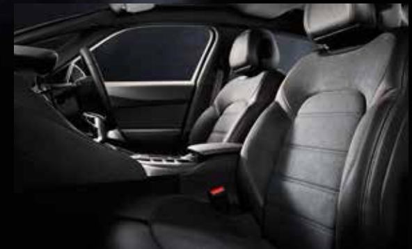
コンビネーションシート(レザー&ダイナミカ) ミストラル