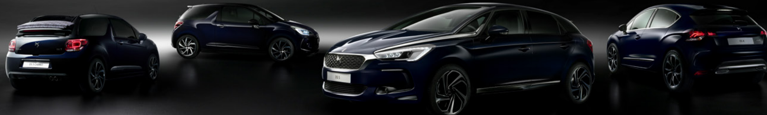
PHOTO: DS EDITION 1955 欧州仕様車

■本仕様は予告なく変更することがあります。■本カタログの写像是撮影条件により実物と印象が相違する場合があります。また、ボディカラー及び内装色も実車と違って見えることがあります。■本カタログに掲載された写真は、一部欧州仕様のもも含まれます。■著作権は、プジョー・シトロエン・ジャポン(株)に帰属しますので、無断掲載を禁じます。■ボディカラーによって納期が異なる場合があります。■詳しくはDS販売店にお問い合わせください。