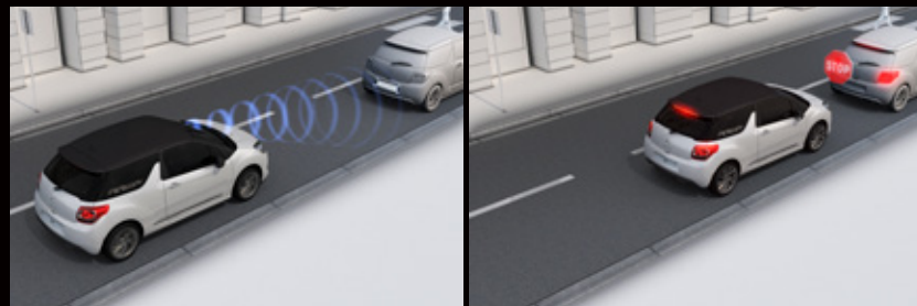
アクティブシティブレーキ作動イメージ

*Chic DS LED Vision Package、CABRIO Chicに装備