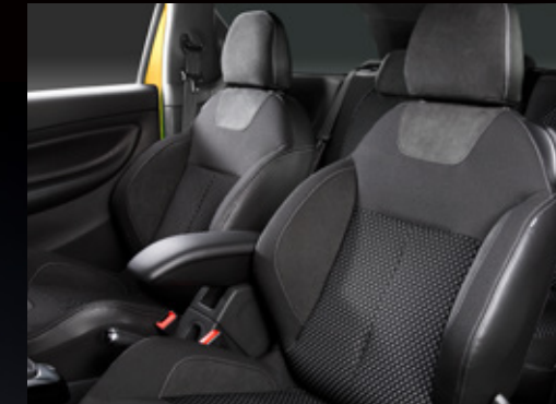
ダイナミカ & ファブリック (ミストラル) ※センターアームレストは非装備となります。