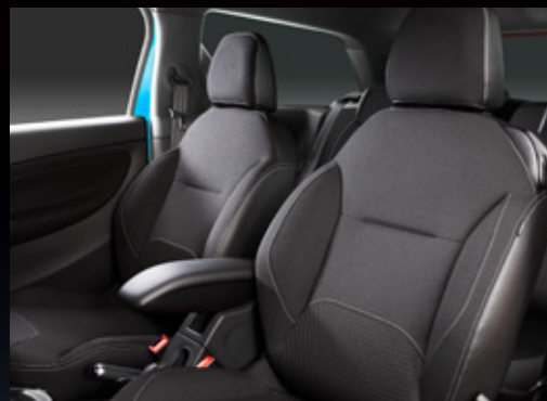
ファブリック (ミストラル) ※センターアームレストは非装備となります。