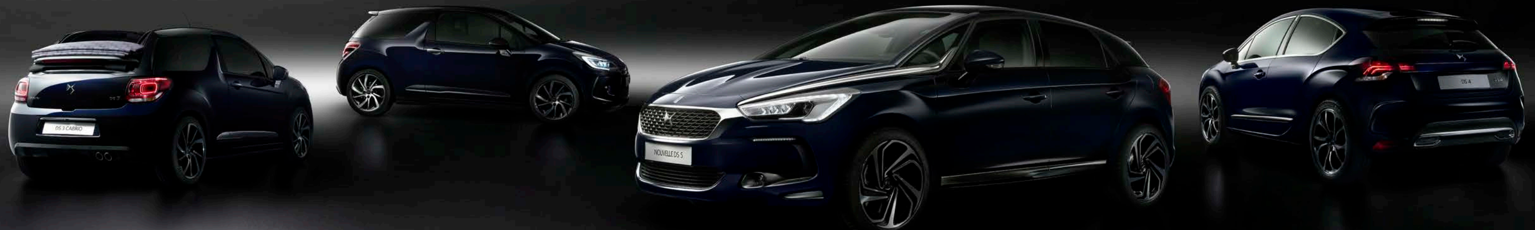
PHOTO: DS EDITION 1955 欧州仕様車

■本仕様は予告なく変更することがあります。■本カタログの写実は撮影条件により実物と印象が相違する場合があります。また、ボディカラー及び内装色も実車と違って見えることがあります。■本カタログに掲載された写実は、一部欧州仕様のものも含まれます。■著作権は、仏オートモビル・シトロエン及びプジョー・シトロエン・ジャポン(株)に帰属しますので、無断掲載を禁じます。■ボディカラーによって納期が異なる場合があります。■詳しくはシトロエン販売店にお問い合わせください。