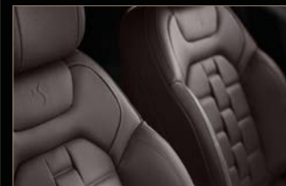
クラブレザーシート(セミアニリンレザー) クリオロ