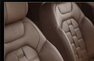
クラブレザーシート(セミアニリンレザー) / ハバナ