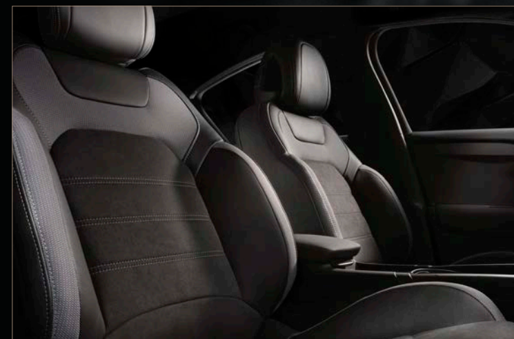
コンビネーションシート(レザー/ダイナミカ/ファブリック) ミストラル