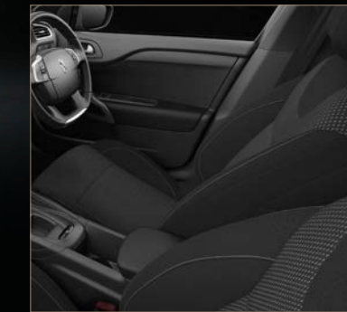
ファブリックシート ミストラル