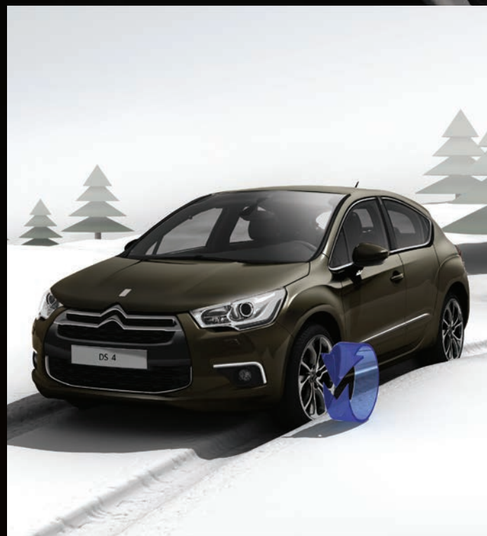
ESP动态稳定控制系统 ABS+ASR+EBV及智能循迹系统