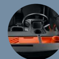
ESPACIO DE ALMACENAMIENTO