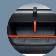
REDES PARA LAS PUERTAS