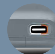
STICKERS PARA LAS PUERTAS