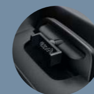
PINZA PARA SMARTPHONE

Red para las puertas, alfombrillas de suelo, espacios de almacenamiento, pinza para smartphone, cajetín DAT@AMI para conectar su smartphone... para hacer que MY AMI CARGO sea aún más funcional, todos estos accesorios están disponibles en https://www.mister-auto.es/ . También se pueden encargar en la red homologada Ami Citroën y Eurorepar Car Services. Para dar un toque de originalidad al interior, una colección de productos y objetos coloridos AMI está disponible en la tienda en línea Citroën Lifestyle: https://lifestyle.citroen.com .