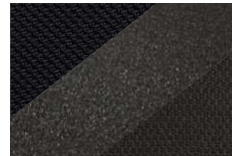
Tissu Diamant noir et Suédé/Tep Fama*