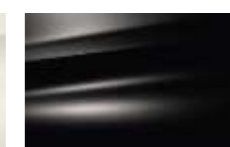
Noir Perle (N)