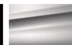
Gris Cool Silver (M)