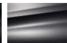
Gris Pilbara (N)