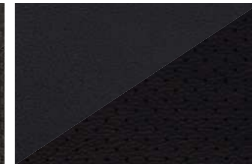
Cuir Dulce et Dulce perforé noir*