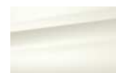
Blanc Antarctique (O)