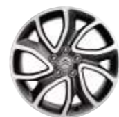
Jante 18" Sycamore