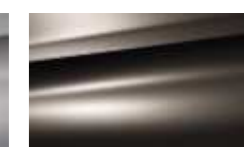
Brun Mangaro (M)