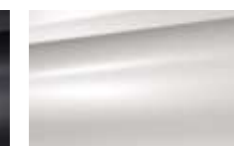
White Pearl (N)

* Et autres matières d'accompagnement. (M) : métallisée - (N) : nacrée - (O) : opaque. Les teintes métallisées, nacrées et Blanc Antarctique sont disponibles en option.