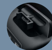
PINCE POUR SMARTPHONE

filets de porte, tapis de sol, bacs de rangement, pince pour smartphone, boîtier DAT@AMI permettant de connecter son smartphone... pour rendre MY AMI CARGO encore plus fonctionnel, tous ces accessoires sont disponibles sur misterauto.com . le site est également accessible via My Citroën. pour une touche d'originalité à l'intérieur, une collection de produits et d'objets colorés AMI est disponible sur la boutique en ligne Citroën Lifestyle : https://lifestyle.citroen.com .