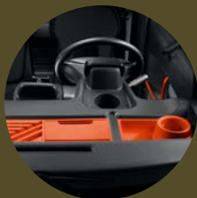
BACS DE RANGEMENT