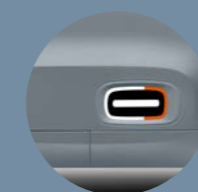
GÉLULES DE PORTE