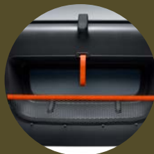
FILETS DE PORTE