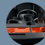
BACS DE RANGEMENT