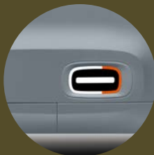
GÉLULES DE PORTE