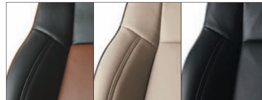
ÉBÈNE AVEC EMPIÈCEMENTS ET PASSEPOIL BRUN MAROCAIN