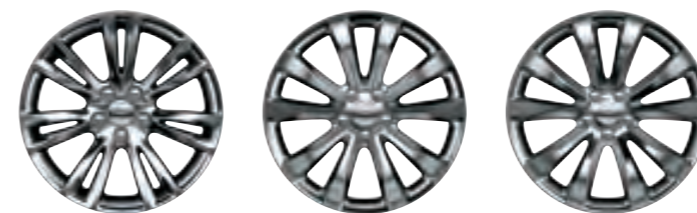
DE SÉRIE 18 POUÇES EN ALUMINIUM POLI (WPC)