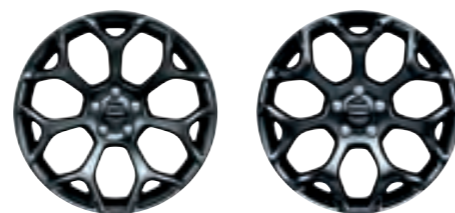
DE SÉRIE 20 POUÇES EN ALUMINIUM HYPER NOIR (WRS)