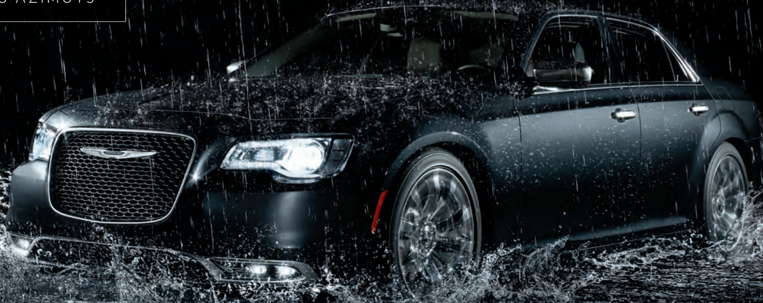
300C Platinum en triple couche nacré noir illusion