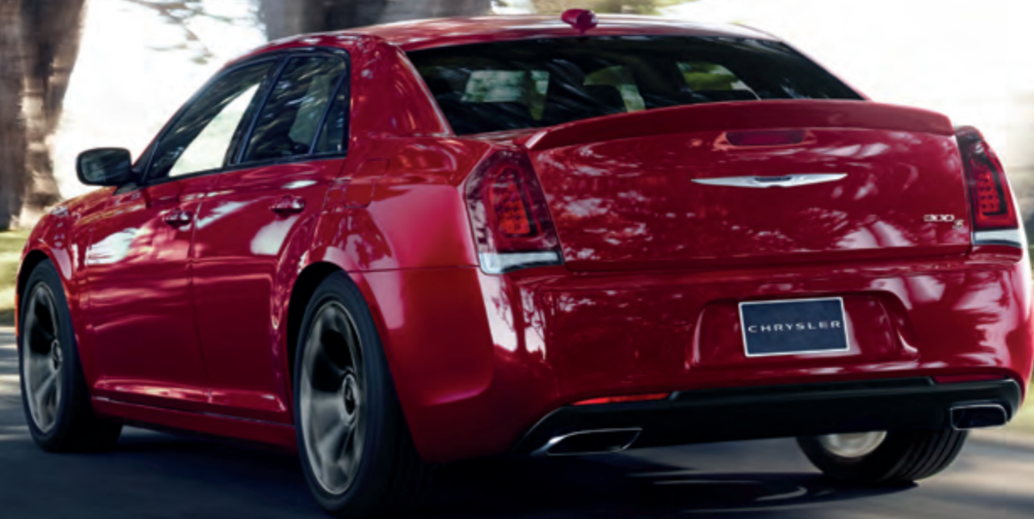
300S en triple couche nacrée ligne rouge