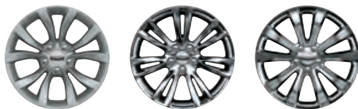
DE SÉRIE 17 POUÇES EN ALUMINIUM ARGENT TECH (WBG)