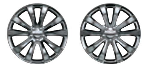
DE SÉRIE 20 POUÇES EN ALUMINIUM POLI (WFY)