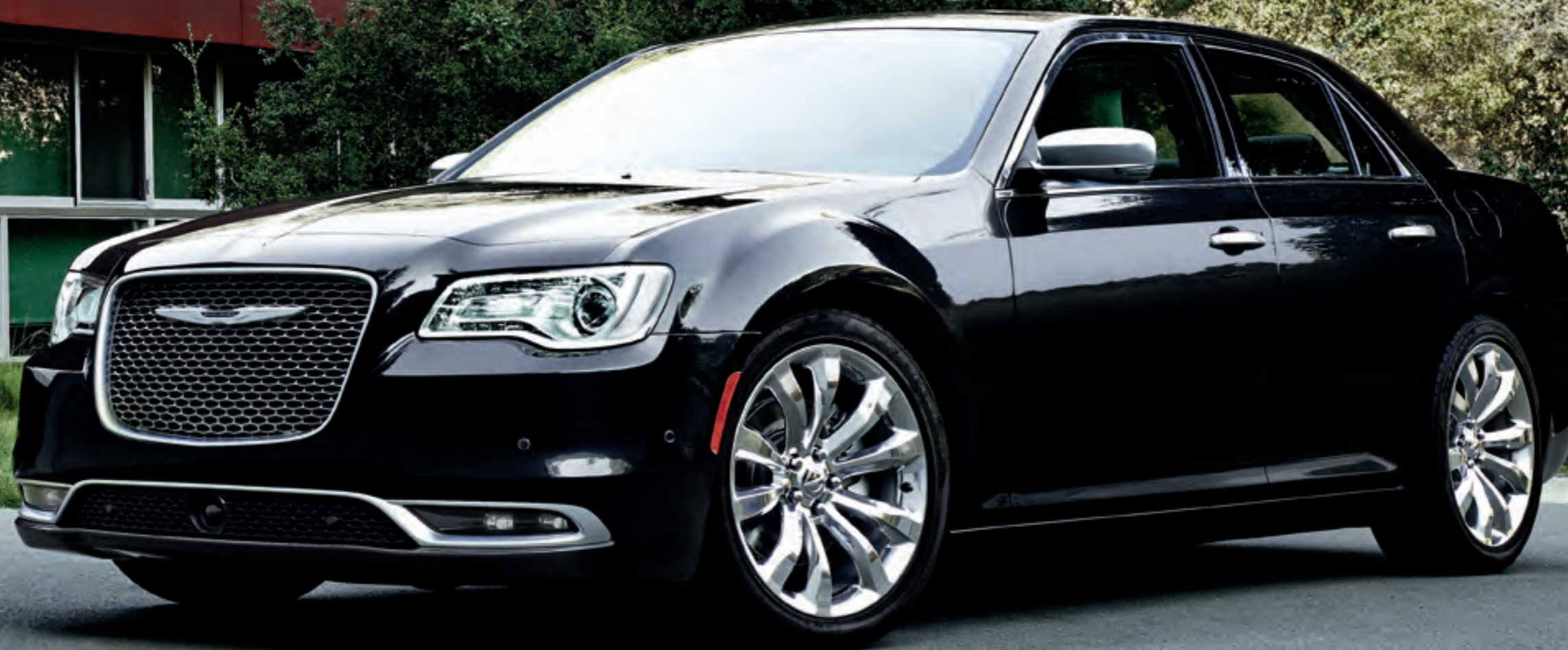
300C Platinum en noir brillant

SOIXANTE ANS D'ÉLÉGANCE. Redéfinition audacieuse de la berline classique nord-américaine. Éléance exquise. Finition très soignée. Technologies de pointe. La nouvelle et élégante Chrysler 300 se dote d'une silhouette sculptée et expressive, de nouvelles calandres audacieuses et de nouveaux designs intérieurs élégants. Les modèles actualisés misent sur les performances, l'efficacité énergétique, les technologies de pointe et un style sculpté. Quatre modèles axés sur le style de vie mettent en valeur le grand pouvoir de séduction de la berline Chrysler 300 qui reçoit le moteur primé V6 Pentastar MC 3,6 L à distribution variable des soupapes (VVT), la transmission automatique 8 vitesses TorqueFlite MD livrée de série et en exclusivité dans la catégorie 1 et, en option, la transmission intégrale (TI) la plus évoluée de la catégorie sur le plan technologique 1 . Livrable en option, le moteur V8 HEMI MD 5,7 L à VVT et système à cylindrée variable écoénergétique (MDS) est maintenant couplé à la transmission 8 vitesses, une combinaison exceptionnelle de puissance et d'efficacité énergétique.